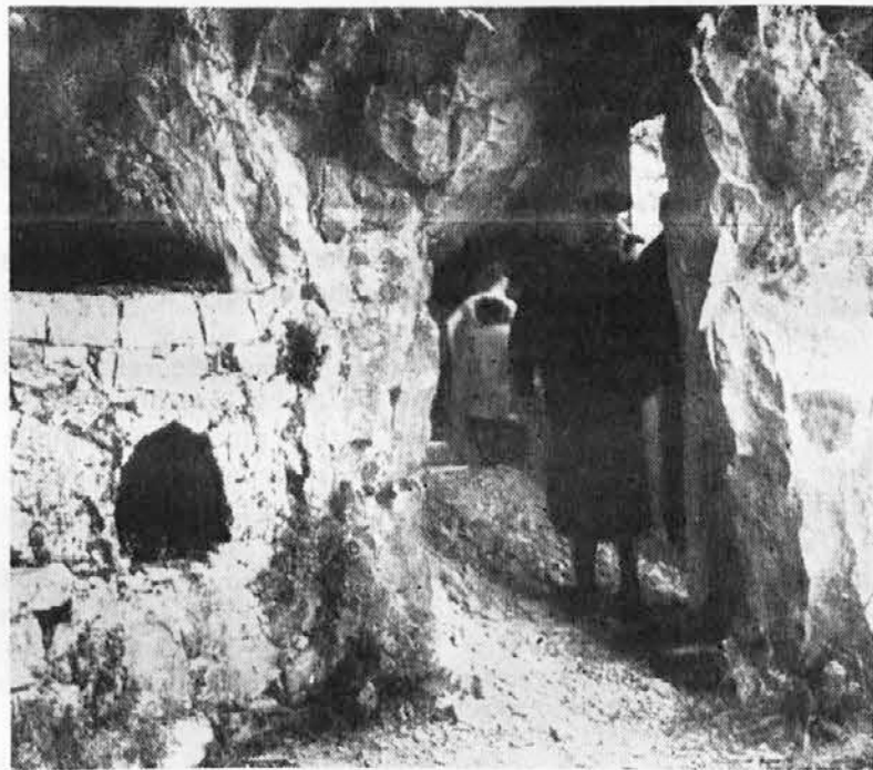
Na sliki vidimo znamenito Landarsko jamo, kamor so se nadiški Slovenci zatekali pred Huni in Turki. Dobro je vidna tudi krušna peč pred vodom v votlino