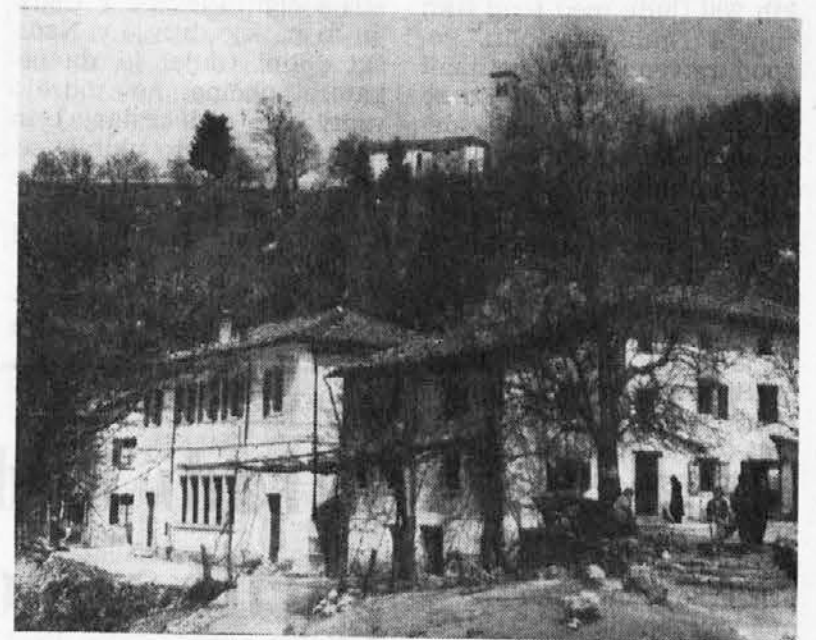
Vasi dreške občine so razvrščene v kolobarju sredi hribov, kakor v kakem amfiteatru in ena teh je Kras, ki jo vidimo tukaj na sliki

V Stoblanku so na pobudo domačega župnika in s pomočjo oblasti zgradili udobno in prijetno dvorano za razne prireditve. Toda za sedaj še sameva. Morda bo v njej kmalu gostovalo gledališče iz Nove Gorice. V Slovenski Benečiji ni večjih domačih ansamblov ali igralskih skupin. Vasi so skoraj povsod prazne. « Ubija me samota v teh hri-