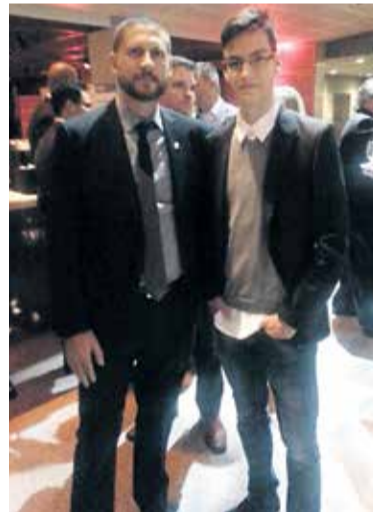
Mladi Domžalčan na svetovni premieri filma Bes v Washingtonu v družbi Davida Ayerja, režiserja, producenta in scenarista filma.