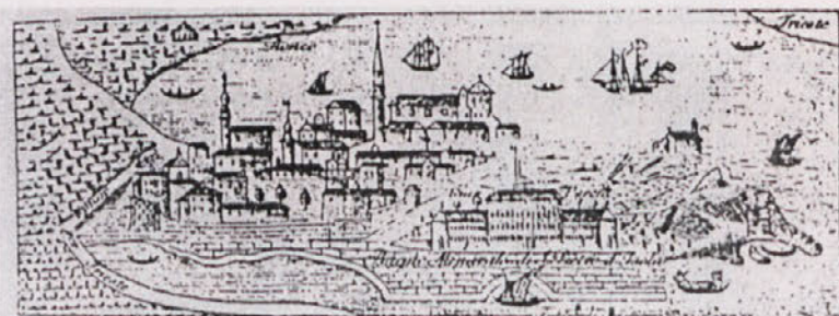
Panorama Izole iz leta 1832, objavljena ob izidu brošure "Terme v izolskem S. Pietru".