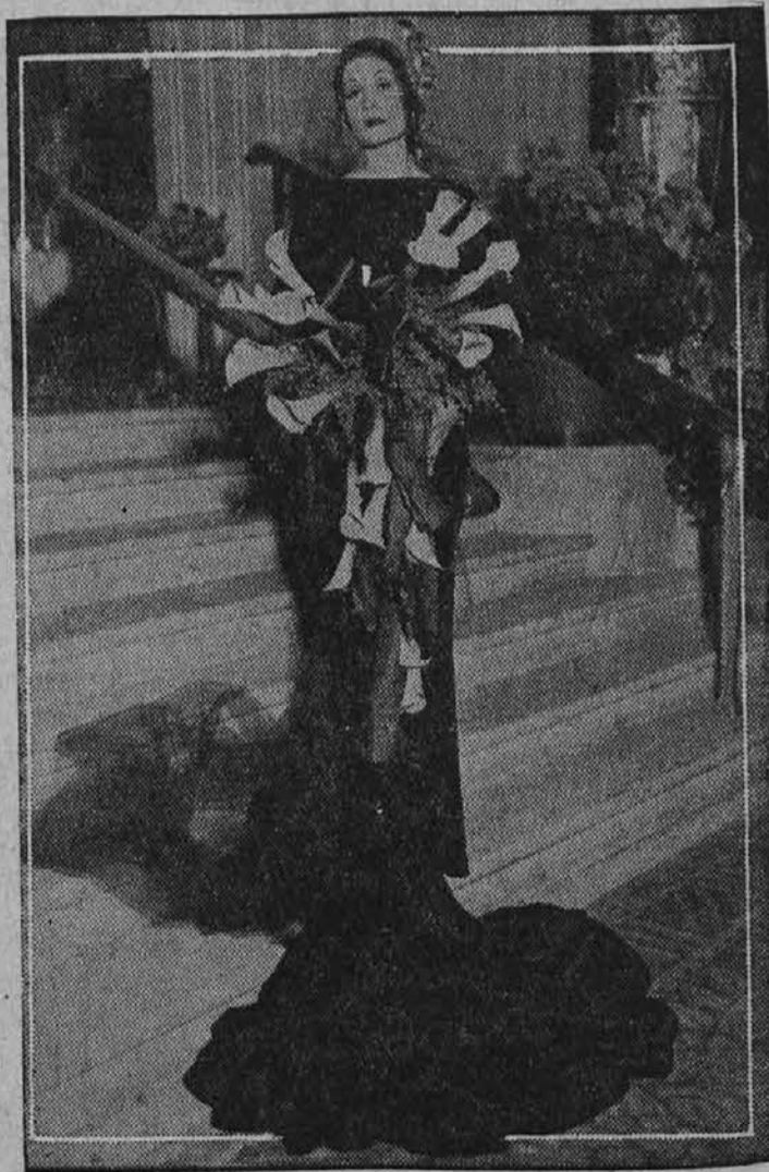
Ena izmed najbolj razširjenih modnih revij v New Yorku je priobčila ta-le model poročne obleke iz črne svile kot najnovejšo modno idejo.