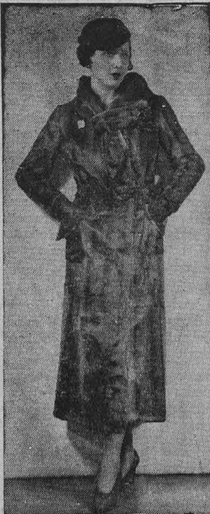
Kozu za evropsko modo 1933

Prerezana čebula ne splesni, če jo obesi na žebelj: skozi nenarezano