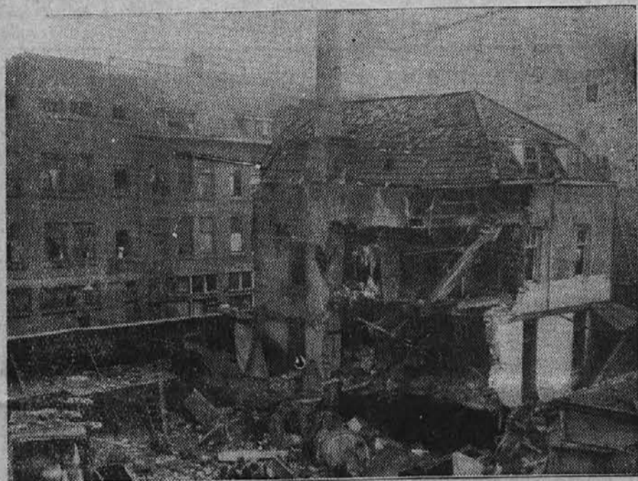
Radi hude eksplozije v neki rotterdamski pralnici je mnogo delavcev in delavk izgubilo življenje.