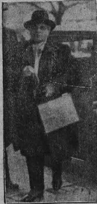
Francoski zunanji minister Paul Boncour

dni prodrle v javnost prve podrobnosti o Hitlerjevih zahtevah. Nemški predlogi na podlagi katerih bi bila hitlerjevska vlada pripravljena obnoviti s Francijo neposredna pogajanja, ki naj bi ugledila pot za povratek Nemčije v Družbo narodov, so v glavnem sledeči: