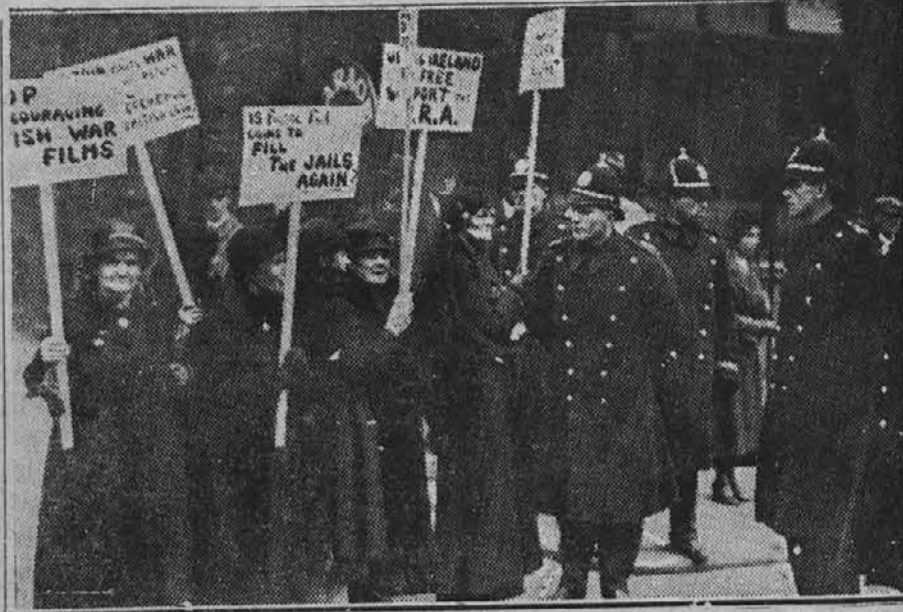
Mamice demonstrirajo v Dublinu: priporočajo bojkot proti angleškim vojnim filmom

Ruska mesta so po vojni hudo narasla. Ob 16. obletnici revolucije so objavili statistiko o ruskih mestih. Mestnega prebivalstva je l. 1914. bilo v Rusiji 25. milijonov, l. 1933. ga je bilo pa že 39 milijonov. Moskva šteje danes 3.572.000 prebivalcev, Harkov, glavno mesto Ukrajine, 646.000 (l. 1914. le 313.000). Tudi nova mesta v Sibiriji so naglo narasla. Magnitogorsk ima že 230.000, Kibinogorsk 40.000 prebivalcev, Stalinsk v Kavkazecu, ki je l. 1914. imel le 2000 duš, jih ima danes 249.000.