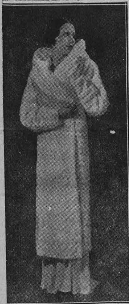
Zimska moda v Evropi: razkošen, kožuh iz hermelina