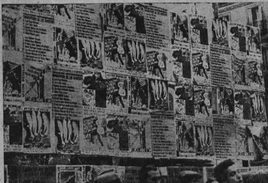
Kako so španske stranke plakativale zidove povodom zadnjih volitev