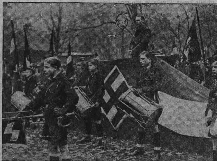
Tudi nemški fašizem vcepja mladini militaristični duh: Ena izmed številnih parad, ki so sedaj v Nemčiji na dnevnem redu

Takšnega mnenja je na primer tudi bivši francoski ministrski predsednik Tardieu, ki je te dni v nekem članku priporočal svoji vladi, naj okrepi zvezo s prijateljskimi državami v Osrednji Evropi in na Balkanu, tako da bo lahko nastopala v imenu 150 milijonov evropskih prebivalcev ter mogla Hitlerju brez posebnih komplikacij sporočiti, "da ni angeljček in tudi ne zlomek". Takšna močna zveza bi bila najboljše jamstvo za mir, pa bi se tedaj lahko začelo tudi