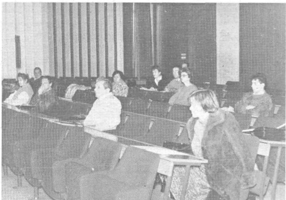
Seminarja o alkoholizmu se je udeležilo okoli trideset predstavnikov ZS iz združenega dela, po čemer bi se dalo sklepati, da alkoholizem ne predstavlja večjega problema v naših delovnih organizacijah. Podobno se je pokazalo tudi pri obravnavi skupščinskega gradiva na to temo, ko je veliko število organizacij odgovorilo, da tega problema nimajo.

Družina alkoholika navadno skriva alkoholizem in se izolira od ostalih ljudi, se dezorganizira, razpade in kasneje ponovno združi. V družinah, kjer je doma alkohol se navadno vrstijo pretepi, pomanjkanja, najhujše posledice pa seveda trpijo otroci.