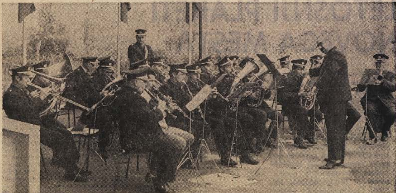
Godba iz KAPEL: oktobrska nagrajenka