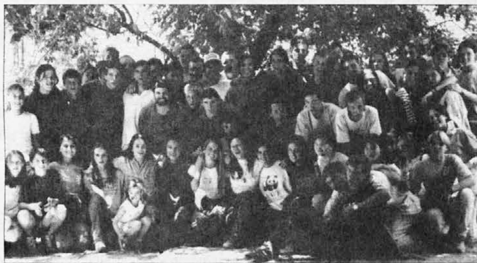
Vesela družba slovenske mladine na taborjenju v Mendozii. Poročilo o tem smo objavili v prejšnji številki Svobodne Slovenije.