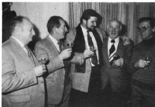
Povsod med Koroškimi Slovenci je bil sprejem prisrčen.