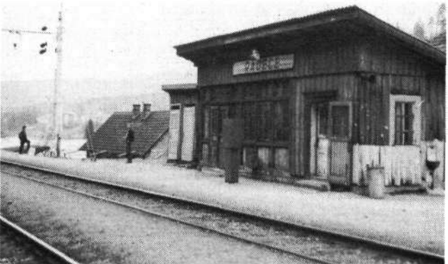
Železniška postaja Radeče!

Radeče, 26. januarja — Na križišču pri mostu, med železniško progo in magistralno cesto, kjer stoji nov objekt Bistro, naj bi bila nova lokacija nove železniške postaje Radeče. Zvedelo se je, da je odločitev dokončna, da je zadeva dokumentacijsko urejena in da bi se gradnja lahko kmalu tudi začela. Nekateri že komaj čakajo, da bi jo končno le dočakali. (dama)