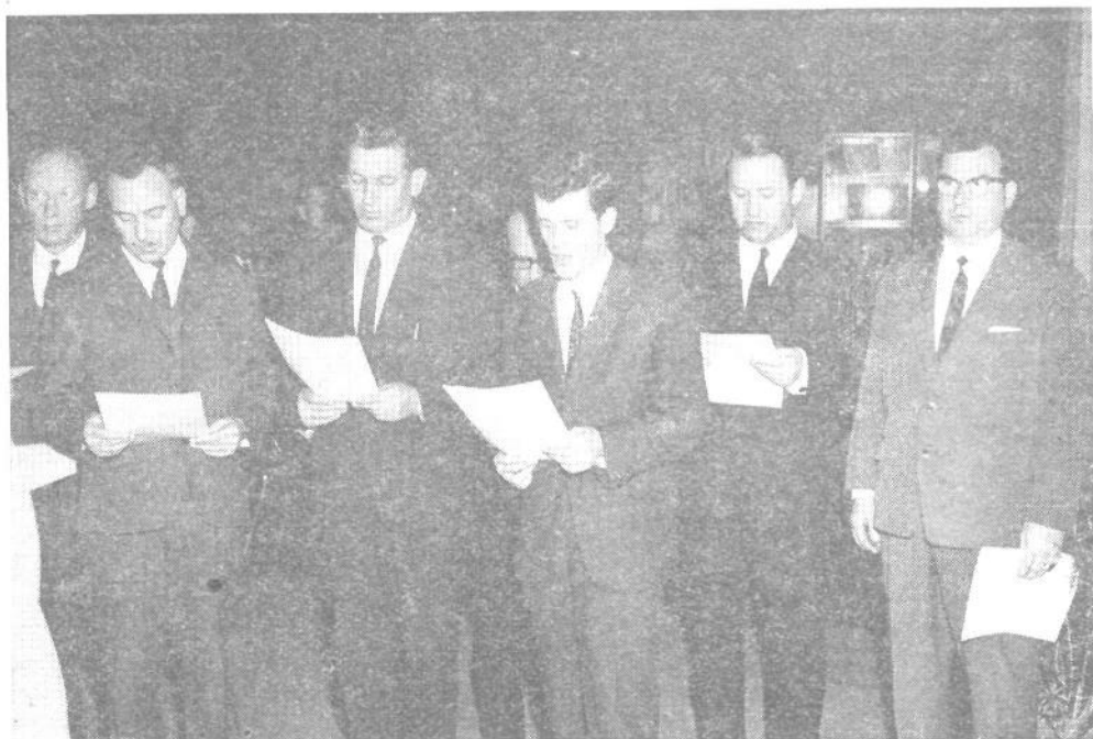
Svečana zaprisega novoizvoljenih odbornikov

Kakor smo izvedeli, bodo vsa društva prijateljev mladine uvedla s 1. junijem uradne dneve, v katerih bodo starši dobili pojasnila o letovanju, vplačilu, odhodih otrok itd.