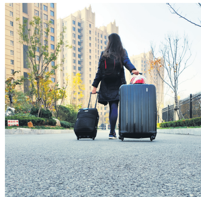
Štorkija s prtljago se je pričela novembra 2019, ko sem se odločila, da bom prekinila delo učiteljice angleščine in za nekaj mesecev potovala po državi.