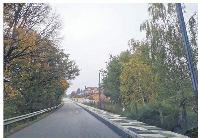
Posebnost Trojiške promenade je tlakovan pločnik.