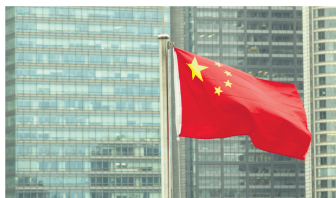
V začetnih koronarnih časih so pošiljke iz Kitajske veljale za sumljive in so bile pogosto zavrnjene.

kovčki že na tisoč šeststo kilometrov dolgi poti na jug, so se skoraj čez noč zaprle vse sosednje države, vključno s kitajskimi posebnimi administrativnimi območji: Hong Kong, Macau in Tajvan – tudi po skoraj dveh letih je prestopanje teh meja še zmeraj težavno. Čeprav so bili kovčki sedaj veliko bližje mojemu dosegu, pa nisem mogla do njih, saj so se zaprle avtoceste, javni promet pa se je popolnoma ustavil (še v vaseh so kmetje tu in tam zasipali kakšno cesto). Kitajska viza se mi je počasi iztekala – to