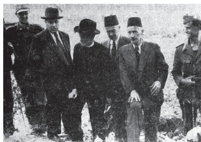
Glavni izkopavalec na Ptujju bil Josip Korošec (prvi z leve). Na fotografiji v oficirski uniformi NDH ob sprejemu eminentnih gostov med izkopavanjem Marindvora v Sarajevu leta 1943.