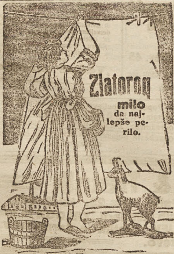
Prva mariborska tovarna mila Maribor.

Brzojavi: Tonejc Maribor. Ček. račun št. 11.963