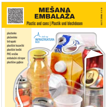
Nalepka na zabojniku za mešano embalažo

Odvoz oz. praznjenje zabojnika za mešano embalažo se ne zaračunava , zato vse občane občin Bled in Gorje naprošamo, da tovrstne odpadke odlagate v svoje zabojnike, na ekološke otoke pa le v primeru povečanih količin. Praznjenje zabojnikov poteka vsakih 14 dni po Koledarju odvoza mešane embalaže.