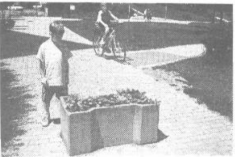
»ERŽIKIN VRTIČEK« že drugo leto opozarja, posnemajte me! Zakaj ne bi v našem okolju, kjer živimo in je naš dom namesto plevela in osata rastle lepe rože, nam in tistim, ki nas obiskujejo v zadovoljstvo in veselje.

Tako pa naselje kaže dokaj klavno podobo. Videz kvartiro med drugim tudi razbite, zanemarjene betonske pregrade, kjer bi morale biti rože, se bohoto plevel,