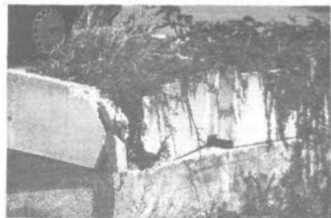
RAZBITE, ZANEMARJENE BETONSKE PREGRADE. Vse to nima nič skupnega z urejenim, kulturnim okoljem. Ali niso to tudi »znamenja«, kako je balkanizem v tem okolju še vedno prisoten.