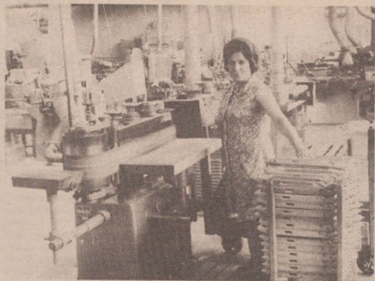
V lesnem obratu na Viču pripravijo ves leseni del utensilije.