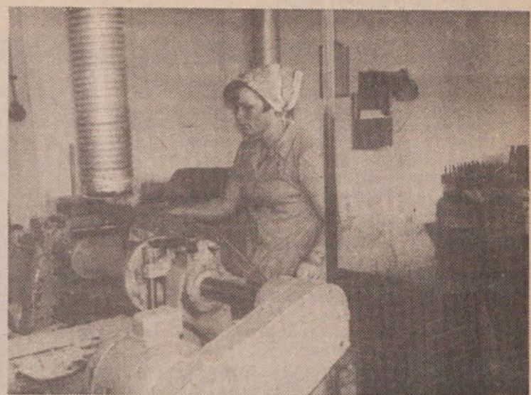
V lesnem obratu Utensilie na Viču sloni velik del proizvodnje na ženskah