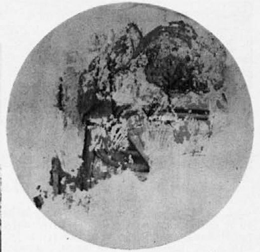
Fresko slika v stari cerkvi v Ratečah na Gorenjskem