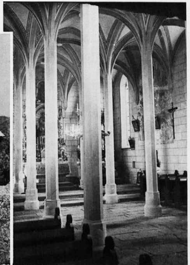
Notranjščina cerkve na Krtni pri Dobu