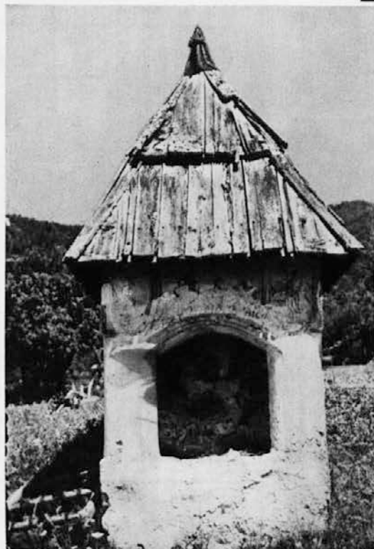
Znamenje v Zalogu pod Storžičem

V sezoni kopalnih in turistovskih vlakov in krajev z internacijalnimi alirami se hodimo torej kopat in na gore in tedaj tudi potujemo skozi naše, slovenske vasi, ki jih seveda tudi gloje črv napredka. Vendar — tedaj imaš malo časa za vas, moral bi tam letovati, jo dalj časa uživati, opazovati, če bi jo hotel tudi spoznati. Mi pa le hitimo skoznje, da pridemo prej do vode, ozir. do vznožja hriba ali še do česa drugega. Domači človek se danes v vasi ne ustavlja, čemu tudi, on je domač, on ni tam ničesar izgubil, njemu je vse to znano iz knjig