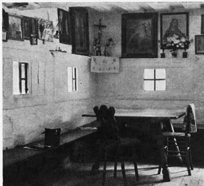
Iliša v Zalogu pod Storžičem

gotških oblik. Duh in obraz te umetnosti te spremlja po znamenjih med polji, tam so čudovite stvari doma, v teh kapelicah in križih, spremlja te po kozolcih in zideh, kjer so majhna svetišča. Stari gradovi in poslopja in dvorci so polni slik in stukatur in zavitih stopnišč. Ko pa stopiš v bolj in bolj redke kmečke bajte stare vrste, si kar pred muzejskim oddelkom: izba na stari način, streha po svoje, ognjišče enako, strop iz tramov in v tramu letnica, skrinja tu, skrinja tam, stara omara in postelja, star porcelan, slika na šipo, pozabljen voz pod kapom in tako naprej brez konca. In danes te stvari bolj in bolj odhajajo od nas in naše vasi postajajo prazne. In čeprav smo domačini, to vendar lahko iz dna srca obžalujemo.