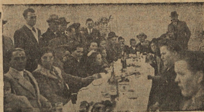
En La Paternal el 8 de julio. — Drugo omizje čajanke.

La mujer le entregó entonces al niño y el capitán arrodillado con el chico en sus brazos rezó: "Dios grande, Dios justo,