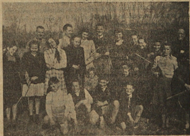
V Recreo Europa smo dobili tudi žogo in lepo igrišče. Sonce je pregnalo mrz in smo kar pozabili, da je bilo zjutraj —6° C.

Katarina Emmerich pripoveduje iz svojih mladostnih let to-le: "Z očetom sem morala iti večkrat na njivo in pomagati pri poljskem delu. Ko smo orali ali branali, smo večkrat vmes tudi počivali. Ob taki priliki nam je oče rad izpregovoril kaj bodrilnega in poučnega, n. pr. tako-le: "Kako srečni smo, da imamo cerkev ravno pred očmi, da se moremo med delom ozreti tja, kjer je navsetejši Zakrament in zdihniti k svojemu Zveličarju. Bog nas vidi in blagoslavlja naše delo." Če je ob delavnih pozvonilo za sv. mašo, se je oče odkril in rekel: "Zdaj se bomo pa udeležili tudi mi sv. maše." Med delom je nato opozarjal na glavne dele sv. daritve, rekoč: "Zdaj je gloria, zdaj je evangelij, darovanje" itd., vmes je pa vpletal primerne molitve ali pa zapel tudi kako mašno pesmico."