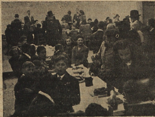
El 8 de Julio se realizó, con motivo de la fiesta de los Santos Cirilo y Metodio, una reunión familiar en la Paternal. Aquí se ve un grupo.