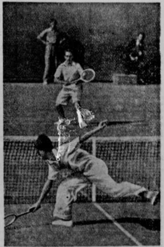
Anglija ima zopet Davisovo kupo: V Parizu je na sklepem boju za najdragocenejšo nagrado teniškega sporta — Davisov pokal — zmagal Anglež Perry proti »lionskemu čarovniku« Cochetu (v ozadju)