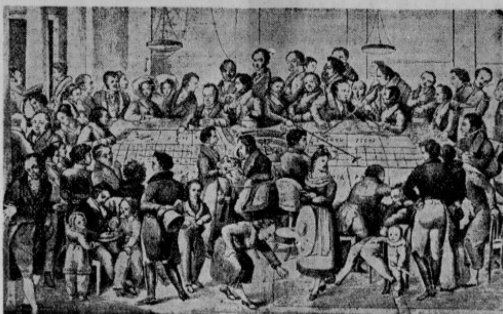
Nov Monte Carlo: Svetovnoznano zdravilišče Baden-Baden dobi zopet svojo igralnico, ki jo je imelo že v prejšnjih dobah, a so jo l. 1872 zaprli. Slika kaže življenje in vrvenje v prejšnji igralnici

Ko je dobila dunajska opera še pred vojno centralno kurjavo, so postale nepotrebne vse dotodanje peči in dimniki. A vodstvo opere je pozabilo, da ne potrebuje niti dimnikarja, ki je bil prej preganjal saje. Dimnikarju se seveda ni zdelo potrebno, da bi nepozvan zapustil službo. Dvajset let je redno prihajal po plačo in z družino vred izkoriščal brezplačne vstopnice za nastavljenca. Šele zdaj, v dobi štednje je nek mestni svetnik slučajno odkril pozabljenega dimnikarja. Mesto je dimnikarja takoj poslalo v pokoj, a mu je moralo nakloniti tudi pokojnino. Saj ima dimnikar 28 let nepretrgane službe.