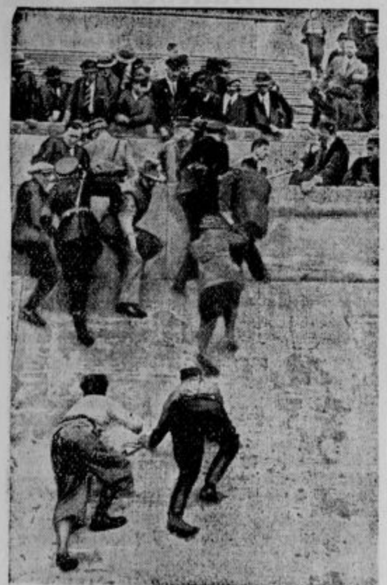
Velika sportna nesreča. Pri motociklističnih tekmah na berlinskem stadionu sta treščili vkup dve kolesi. Eno kolo je vrglo med gledalce. Trije mladi fantje so se smrtno ponesrečili, mnogo je bilo ranjenih. Na sliki vidimo prizor neposredno po nesreči, ko hite na pomoč sanitejci.

V tolažbo pa bodi povedano, da strela kljub svoji strahoti, ne zahteva mnogo žrtev in nek