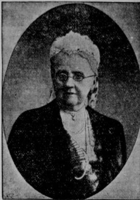
Holandska kraljica mati Ema, ki je 2. t. m. obhajala svoj 75. rojstni dan

zdravnik je izračunal, da je v nekem velikem okraju nalezljiva griža v enem tednu zahtevala dvakrat toliko žrtev kot strela v istem kraju v petdesetih letih.