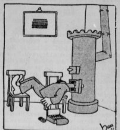
Obziren mož, ki noče osmraditi stanovanja s tobakovim dimom.

»Pomni, če ne boš priden, ne boš zrastel.« »Ti teta torej nisi bila pridna?«