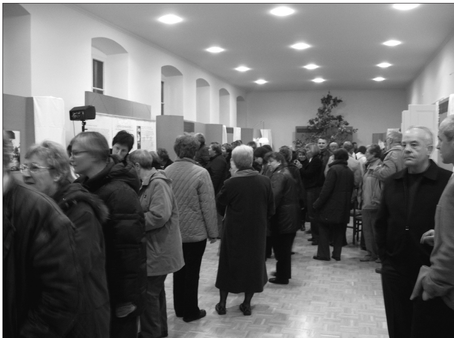
Ob odprtju.

predalnikov ali na policah novodobnih omar ne hranila rodbinske dediščine vezene in tudi s čipko krašene posteljnine, prtov, prtičev, perila, parnih rjuh in podobnega.