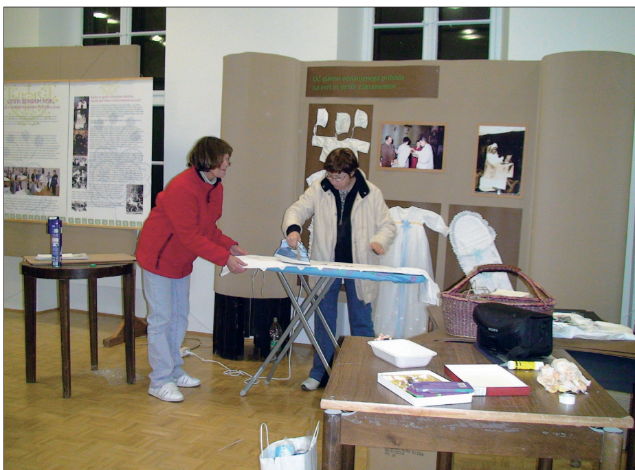
Delovni utrinek s postavljanja razstave, spomladi leta 2008.