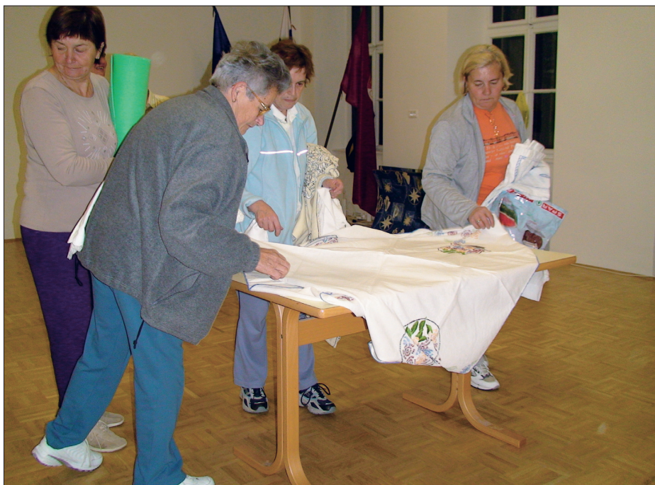
Gibčne žénšce med zbiranjem in fotografiranjem, jeseni leta 2007.