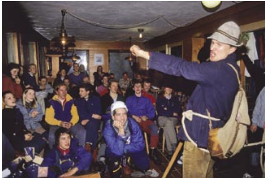
Na enem od sprejemov med alpiniste, kjer je vedno veselo