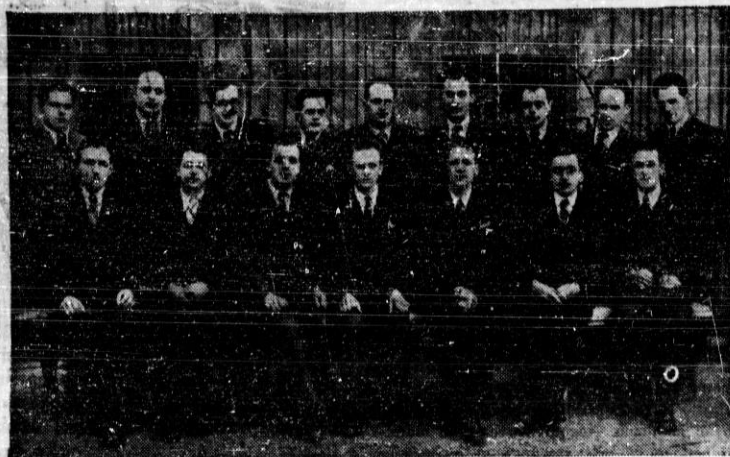
Udeleženci mizarskega tečaja v Kranju.