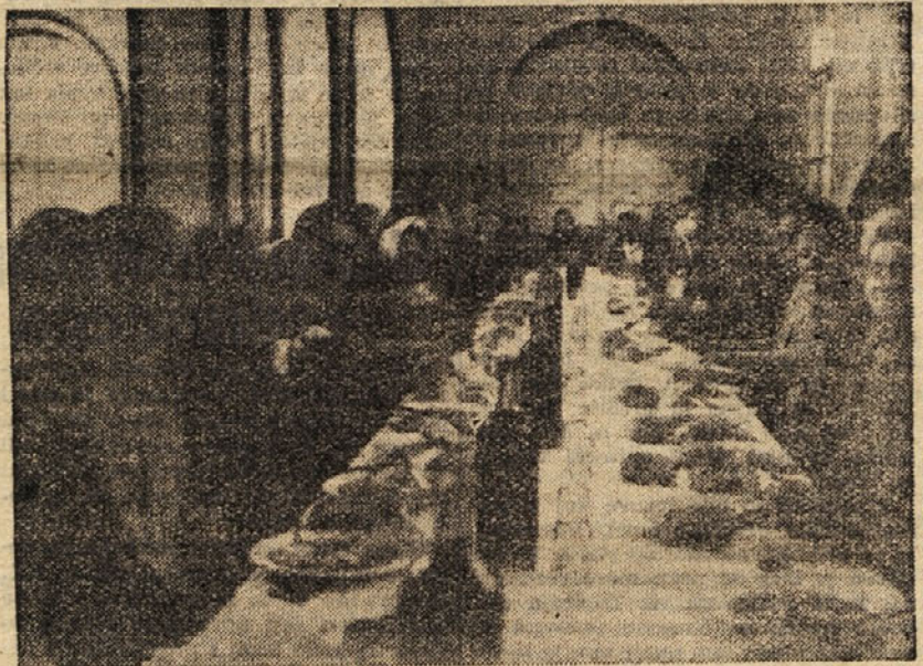
Proslava 8. marca X. b terena

Velika sindikalna dvorana je bila prenamahna za vse. Po govoru se je vršila bogat spored, pevске točke, recitacije, telovadni in zabavni nastopi. Tudi žene XIV. terena so priredile zakusku