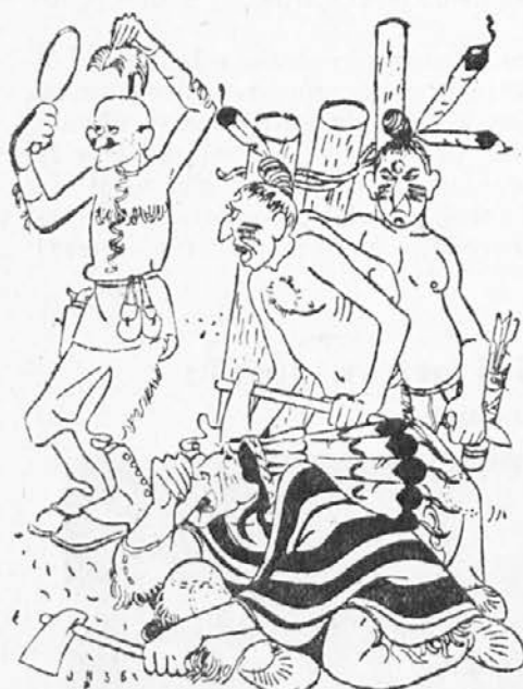
»Veliki Manitu! Poglej Beli Orel, kaj dela blede koža s svojim skalpom«.