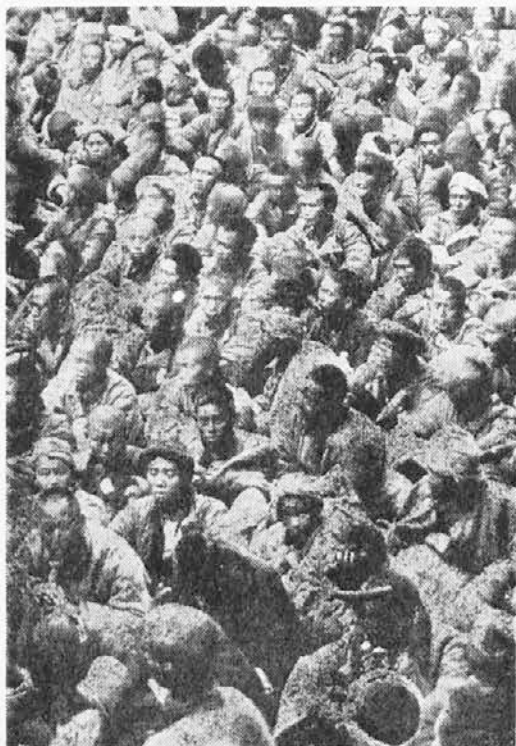
Po resnici hrepene

Družba za širjenje vere je v zadnjem vojnem letu zbrala več kot vsa prejšnja leta. Čeprav je denarni promet zelo otežkočen, vendar skuša pošiljati podporo vsem misijonskim pokrajinam. — To razveseljivo dejstvo pa zatemnjuje drugo, da so ugasnili bogati viri privatne podjetnosti skoraj v vseh evropskih državah. V poštev pridejo zlasti države, ki so največ delale za misijone: Nemčija, Francija, Belgija, Nizozemska in Italija. Kot skromen nadomestek za to občutno izgubo je živahnější delavnost ameriških katoličanov. Papež Pij XII. jih je posebej prosil, da priskočijo na pomoč s podvojeno požrtvovalnostjo.