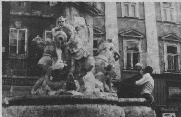
Obnovljeni Robbov vodnjak je deležen pozornosti mladih in starih