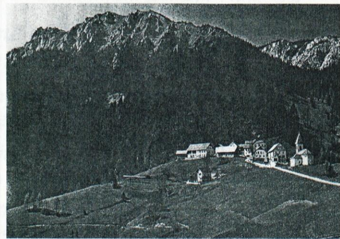
Izhodišče izleta bo slikoviti Prtovč.