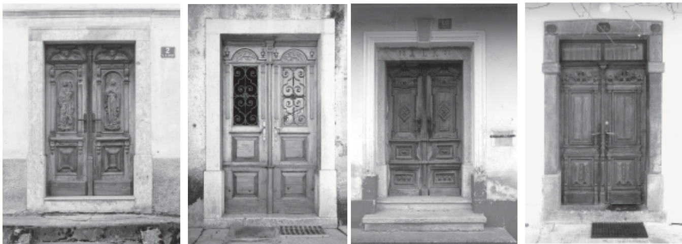
□ DOMAČI REZBARJI SO PRI OBLIKOVANJU VRATNIH KRIL POSNEVALI VZORE PRI VODILNIH NOSILCIH RAZVOJA. "NA POLJIH (VRATNIH POLNILIH) SE NENADOMA POJAVIJO POVSEM DRUGI MOTIVI, KI POSNEMAJO PODOBNE OKRASKE, KOT JIH JE VIDEL (REZBAR) V CERKVI NA BAROČNIH IN ZLATIH OLTARIJAH, NEKOLIKO NESPRETNO REZJANI GRIFONI, KI IZVIRAJO PRAV TAKO IZ VZOROV, KI JIH JE VIDEL V CERKVI, TER LETNICA V BOGATEM RASTLINSKEM OKVIRU" (FISTER, M., REZJANA VRATA V TUHINSKI DOLINI, KAMNIK, 1971, STR. 5). KONČNI IZDELEK, OBDELAVA VRATNIH KRIL, PA JE BIL SEVEDA ODVISEN OD REZBARSKIH IN UMETNIŠKIH SPOSOBNOSTI IZVAJALCA IN ŽELJA IN FINANČNIH MOŽNOSTI NAROČNIKA

Oblikovani in okrašeni leseni členi fasadnih odprtin sicer sooblikujejo zunanjo podobo fasadnih ploskev posameznih stavb, vendar je njihov likovni vpliv na oblikovanje razpoznavnih značilnosti arhitekturnega oblikovanja po posameznih območjih manjši, kot