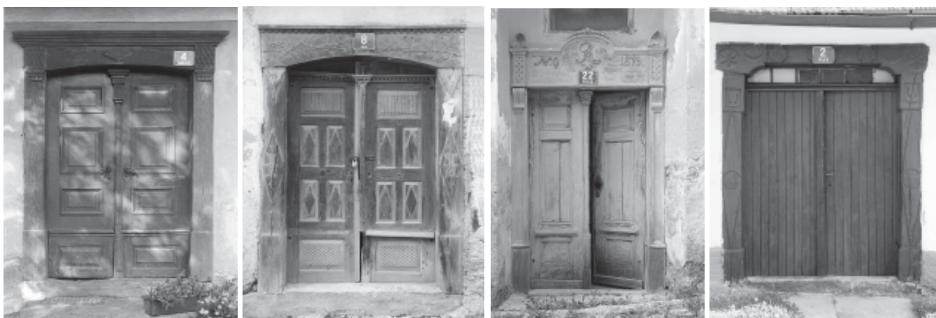
□ "V 19. SOLETJU PA SE PRAV TAKO POJAVIJO LESENI PORTALI, KI SO POSNETEK KAMNITIH BIDERMAJERSKIH OBLIK (PAZDUHASTI PORTAL) Z DROBNIM OKRASJEM (ROZETAMI, GIRLANDAMI IN COFI)". (SOK J., ETNOLOŠKA TOPOGRAFIJA SLOVENSKEGA ETNIČNEGA OZEMLJA - 20. STOLETJE; OBČINA ŠMARJE PRI JELŠAH, LJUBLJANA, 1991, STR.: 191.

poleg profilno obdelanih okvirov polnil vidno poudarjajo preprosto okrašena polnila. Med enostavni okras polnil sodijo zrnato in rebrasto oblikovane površine. Med najlepša vratna krila sodijo gotovo bogato rezljana vratna krila, pri katerih so polnila okrašena z zahtevnimi okrasnimi elementi. Med zahtevne okrasne motive sodijo geometrijski (pravokotniki, rombi, zvezde, rozete, četrtinski izseki iz rozet, volutaste vijuge), baročni (cofi, različni okviri) in rastlinski motivi (stilizirane cvet-