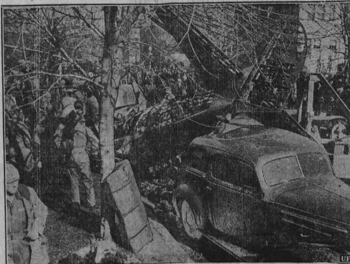
V Washingtonu, D. C. je aeroplan padel na tri avtomobile, jih zažgal in sta bila pri tem ubita dva vojaška letalca. Tri minute prej se je aeroplan dvignil v zrak.