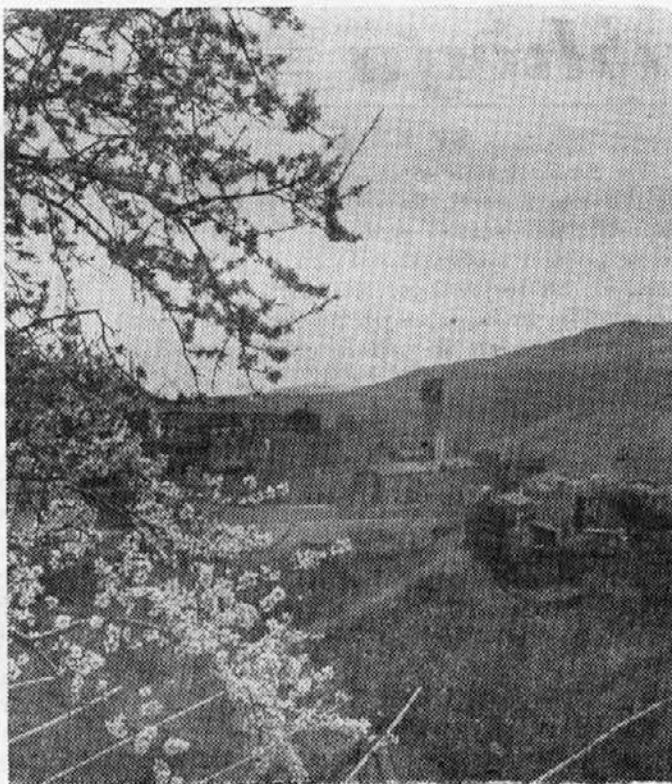
MACKOVLJE V CVETJU

Za svojega naslednika je predlagal Edena, ki je prevzel njegovo politično dediščino.