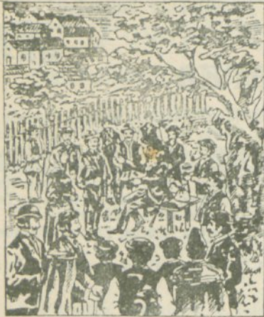
Vidmanič kaže seljanom moč „Pakraških kapljic in Slavonske biljevine.“