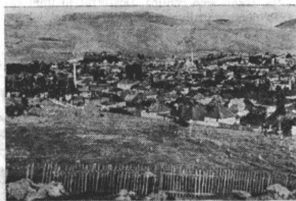
Goli iznad Plevlja

Čemerno, v Rudo in zavila proti severozahodu. Poleg tovornega sva imela s seboj tudi jahalnega konjiča, ki je bil zelo suh in žalostnega izgleda. Mokrih očes je obračal glavo in se oziral proti Plevlju, hoteč najbrž opozoriti jezdeca, da ga ne more nositi, ker je lačen in