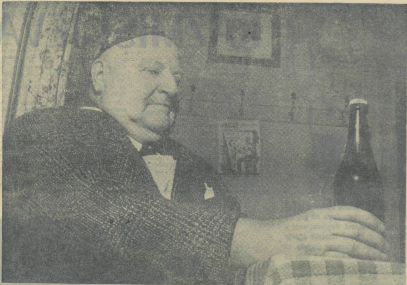
Zdaj pa dajmo tistega, tistega od zida..., a za spremembo si ata Katrcia natoči tudi pene...