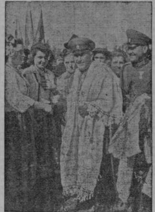
Ko so Bolgari zasedli od Romunov odstopljeno Dobrudžo, so tamošnja dekleta ogrnila bolgarskega vojnega ministra z lepo narodno vezenino

Ker je račun kazal, da bi napeljava do njihovih hiš razmeroma več stala kot do drugih pri Veliki Nedelji, v Mihovcih in Trgovišču, so sklenili, da prispevajo še več kot drugi s tem, da si — poleg drugih običajnih stroškov — še sami kupijo drogove in izkopiyeo jame zanje. Kako se razlikujejo od nekaterih drugih, ki jim bodo žice skoraj po svistih brenkale, pa si nočejo dati napeljati zdaj, temveč čakajo boljnih časov. Seveda, nikdar niso vsi za vsako stvar in razlika mora biti. Res je sicer, da si nismo izbrali najbolj ugodnih časov za take precej drage reči, toda če bi se še letos ne bili zedinili za to, za kar smo se z malimi presledki borili malodane 20 let, bi še dolgo dolgo ne prišli na cilj. Mislimo, da smo se »dognali« samo nekoliko pred 12. uro, ker bi bilo pozneje še manj mogoče, saj vidimo, da cene vsem potrebščinam za elektriko iz dneva v dan rastejo. — Ko pa se enega uspeha veselimo, nas žalosti neka druga za-