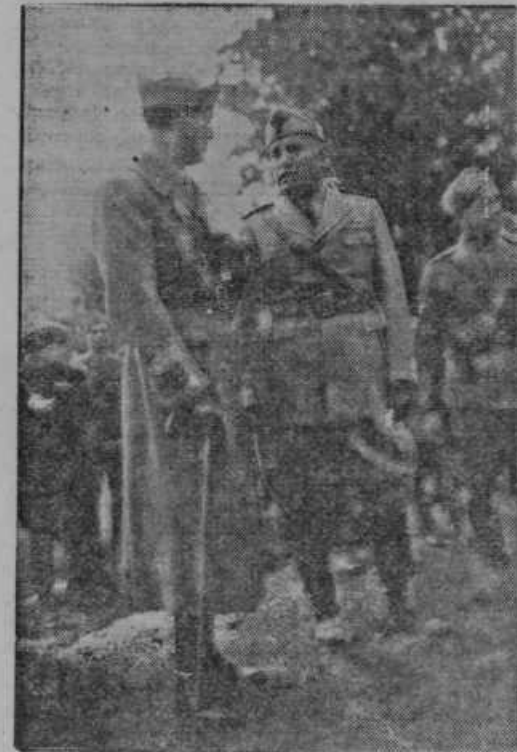
Mussolini se razgovarja z italijanskim prestolonaslednikom Umbertoom na Krasu ob priliki pregleda italijanskih čet

Sv. Marjeta niže Ptuja. Vreme se nam je spremenilo na jasne, precej hladne noči, mrzla jutra s slano, meglene dopoldneve in sončne popoldneve. Zato jesenska dela hitro napredujejo. Spravljanje koroze, ki je letos prav dobro obrodlila, hitro zaključujemo. Tudi krompirja se je letos precej nakopalo. Ajde pa bo le srednje. Vinskega mošta se je pridelalo prav malo in je srednje kakovosti. Druga leta so se vinogradniki pogovarjali, koliko polovnjakov ga je kdo naprašal, a letos le, koliko brenč grozdja so kje imeli. Zato bi kake nenadne volitve ne bile nič šumne in živah-