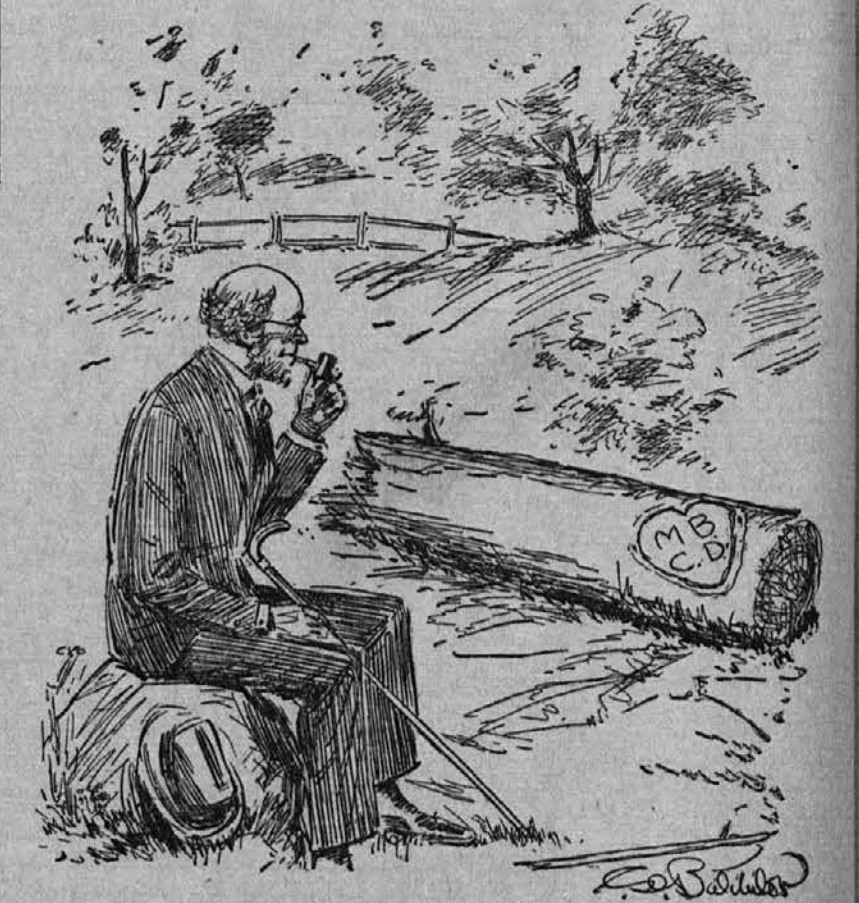
REVERIES OF A BACHELOR