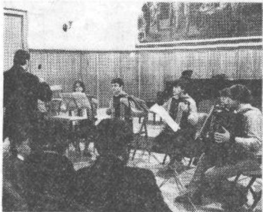
S koncerta v mali dvorani Slovenske filharmonije

Na revijah imajo glasbene šole možnost sodelovati z najboljšim, kar imajo po lastnem izboru, vendar v okviru tematike, ki jo predlaga organizacijski odbor revije. Letos so bile to skladbe jugoslovanskih partizanskih skladateljev in revolucionarne skladbe vseh narodov