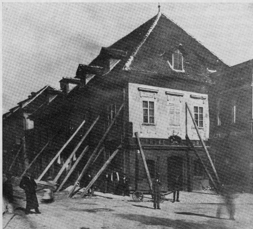
Mayerjeva lekarna nasproti frančiškanske cerkve, popotresna fotografija 1834

Za svoja dela je Cragnolini rabil mnogo pomočnikov, vendar mu ljubljanski magistrat ni dovolil, da bi jih javno najemal. 34 Nasploh so domačini Cragnolinija poskušali onemogočiti, kjer je bilo le mogoče. Stavbni mojster Vadlav je budno pazil na vsak njegov korak, da bi lahko naznanil stavbnega gospodarja brez predpisanega dovoljenja mestne Stavbne, gasilne in olepševalne komisije. 35 Cragnolini se je moral večkrat zagovarjati zaradi svojih delavcev. Ker se je veliko mudil v Zagrebu, si tega verjetno ni preveč gnal k srcu. Po računih za hrano in obleko sodeč z ženo, nista živela slabo. Ob manjših naročilih, kot so bile različne prezidave v hiši Karla Recherja na Poljanah 38 ali omenjena uta na Seunigovem vrtu, ometavanje obeh Dolničarjevih hiš na Dunajski cesti 37 in podobno, je leta 1834 v Gosposki ulici prefasadiral hišo