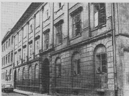
Lazarinijeva hiša v Gosposki ulici 10, fasada 1834