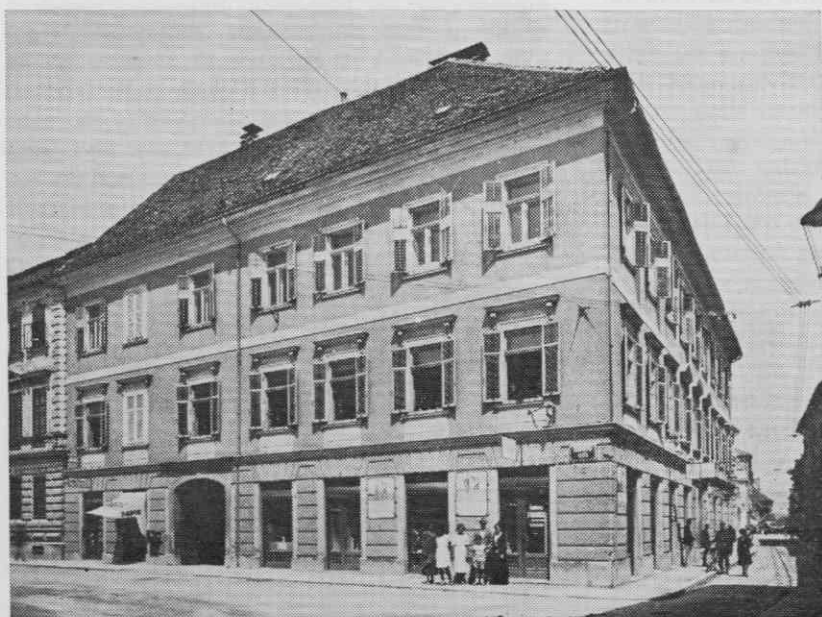
Seunigova, pozneje Luckmannova hiša v Gradišču, sezidana 1832, fotografirana pred podiranjem leta 1931