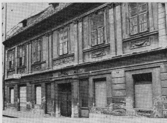
Luckmannova hiša na Poljanski cesti 3, prezidana 1835 ali 1836