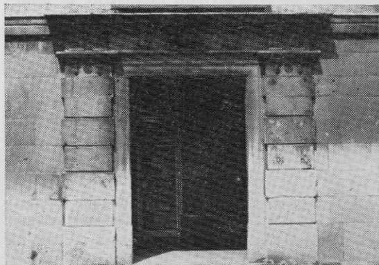
Portal nekdanje Seunigove hiše, Gradišče 4