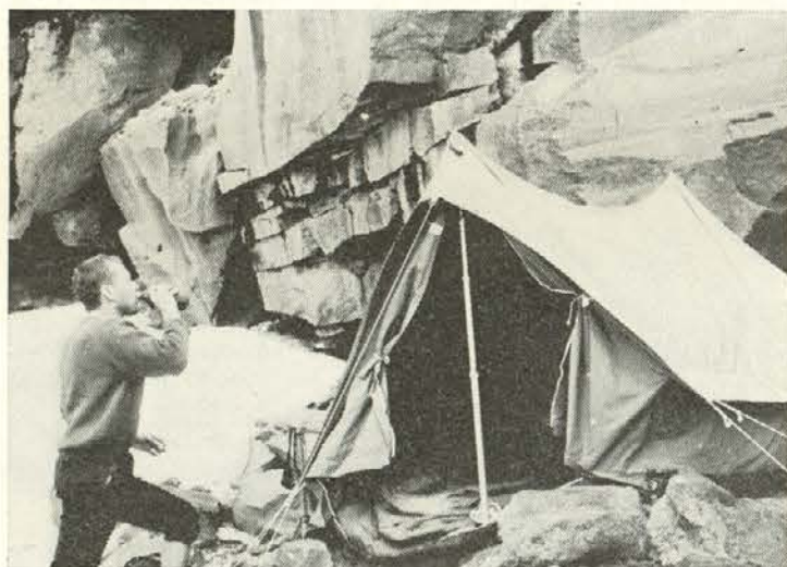
Tabor na višini 3960 m