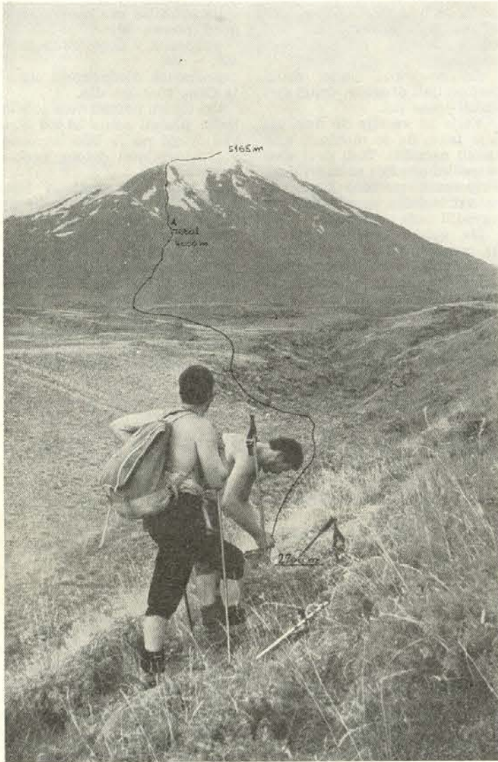
Smer naše poti na Ararat

megla in dež. Pobočje je poraščeno z gozdovi smreke, jelke in macesna. Zdi se nam, kot da bi se vozili po naših krajih. Samo orientalske vasi in lju-