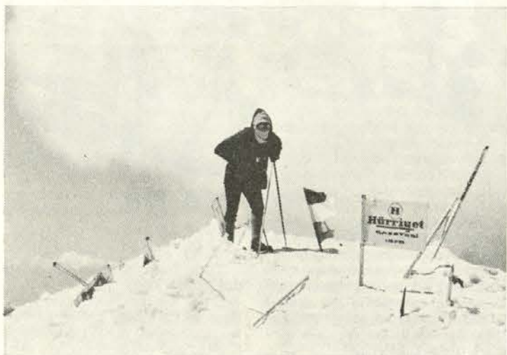
Končno na vrhu