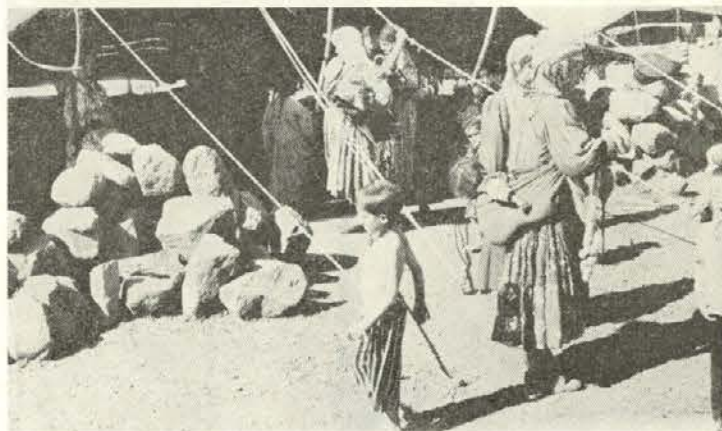
V vasi pastirjev na višini 3100 m

Do noči moramo priti do grape, ki je iz taborišča dobro vidna. Slabo je to, da se tu znoči že okrog šestih, grapa pa je še in še visoko. V taboru smo s kompasom izmerili smer — za vsak primer. Okrog šestih, ko se je stemnilo, smo se izgubili, ali pa ne. Tu človek nikdar ne ve, kje je. Kamen je podoben kamnu, jarek jarku, greben grebenu. Nadaljujemo po kompasu. Višinomer pa se počasi počasi dviguje. Okrog enajstih zvečer pridemo končno do grape na višini 3400 m. Še šeststo metrov višinske razlike je do našega hotela — do šotora, ki so ga na gori za nas pustili prijatelji. Hudo smo žejni. Vodo, ki smo jo nosili s seboj, smo popili. Povedali so nam, da je na višini 3700 m voda. Samo do tja, više in više. Kje si, voda? Okrog enajstih ponoči smo tam, kjer bi morala biti voda. Toda vode ni. So nam prijatelji lagali? Počasi se vzpenjamo više. Preklinjamo kamenje, ki se nam vali izpod nog, prijatelje in sami sebe. Hoja po temu grušču in kamenju je prav mučna. Kamenje je vulkanskega izvora, nekakšna lava, ki je zelo lahka. Kamen, s katerim bi pri nas