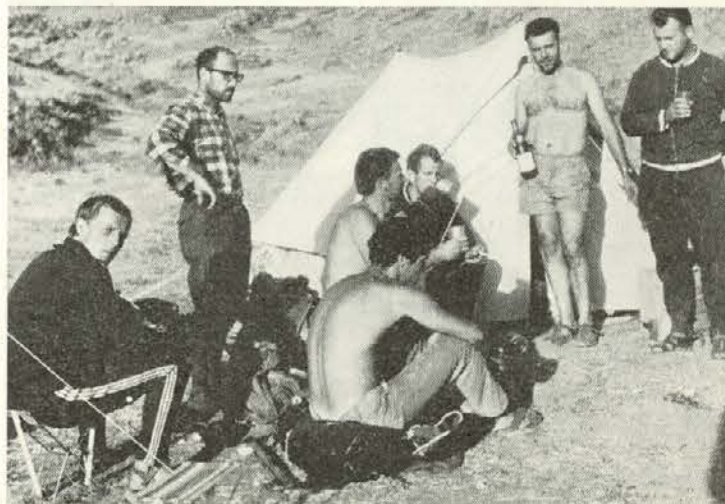
Slavje v baznem taborišču

krat se veselijo. Zato, ker smo prišli na vrh in se srečno vrnili, ter zato, ker smo vzpon opravili v rekordno kratkem času triindvajsetih ur. Steklenica šampanjca (jugoslovanskega) slavje še popestri. Dolgo v noč je bilo slišati domače pesmi. Pred spanjem je bil še kratek posvet za nadaljnjo pot.