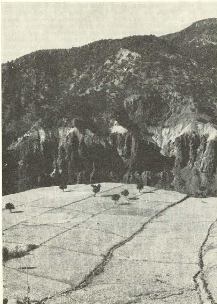
Pokrajina ob pritoku reke Tigris

jaki obkolijo taborišče, trije civilisti in kaplar (vsaj mislim, da je bil) pa prisedejo k nam. Nekaj časa se gledamo, potem pa nam prično razlagati, da moramo podreti taborišče in se odpeljati z njimi. Pravijo, da je tu prepovedano taboriti. Nam se seveda ne ljubi. Mali kaplar, ki gotovo nima vojaške mere, pa je kmalu staknil radijski oddajnik. Ura je pol štiri. Razložimo jim, da imamo na gori prijatelje in da se jim moramo z radiom javiti ob štirih. Od kaplarja hočemo radijski oddajnik. Na vse samo prikimavamo in odgovarjamo z »jok«, kar pomeni ne. Dajo nam četrto ure in sami pridno pulijo kline in podirajo šotore. Kaj hočemo, pobašemo vse v avto. Z nami v avto sede še velikan z avtomatom in že se peljemo proti Dugobayazitu. Med potjo srečamo Francoze. Tudi oni so namenjeni na goro. Naročimo jim, naj našim sporočijo, kam so nas odpeljali.