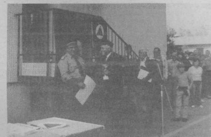
Priznanje za uspešno sodelovanje je prejel tudi poveljnik gasilske brigade

Sploh pa, kot je dejal predsednik IS v pozdravnem govoru, tekmovanja gasilskih enot CZ ne moremo in ne smemo jemati zgolj kot preverjanje usposobljenosti. Sodelovanje obveznikov CZ je tudi odraz njihove pripravljenosti, da ob vsakem času s svojim znanjem in nesebičnostjo pomagajo reševati življenja in materialne dobrine.