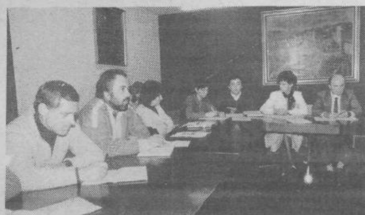
Pred sindikalnimi aktivisti so pomembne naloge