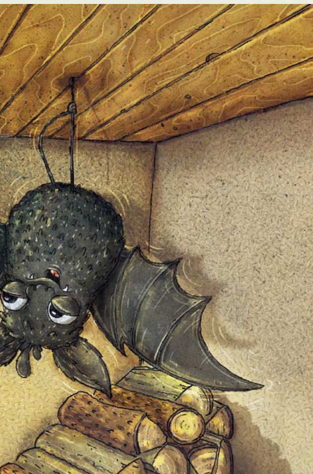
Netopir Frfotir se je sčasoma kar ustalil v zadnji dolini pod Triglavom. Na veliko gospodičnino in Dixieino veselje se je naselil v bližnji drvarnici. Risba: Jernej Kovač Myint

Veselica je trajala več dni in noči. Pili so, peli, jedli in se veselili prihajajoče zime, ko bodo v zavetju tople jame ubežali mrazu. Res so počasi vsi po vrsti otrpnili in zakinkali v trden sen. Tlesna temperatura se jim je spustila na samo deset stopinj Celzija, srce je bilo čisto počasi in tudi vdihovali so le na vsakih devet minut ... Frfotir se je iz zimske odrevenelosti prebudil šele, ko je postalo že pošteno toplo in so ga mušice kar same od sebe začele drezati pod smrkom. Pretegnil je svoje ude, raztegnil prhuti, se poslovil od svojih sorodnikov in odrfrl Pravljičariji naproti. ◉