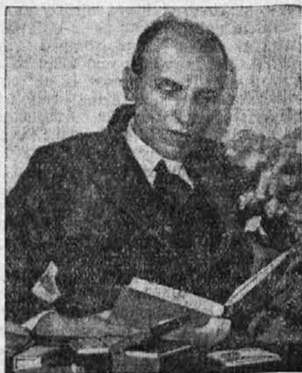
Madžarski min. predsednik Imreedy, ki je obiskal Hitlerja, da bi zastopal Madžarsko.

Toda takoj se je videlo, da tudi s tem ne bodo zadovoljni. Madžari in trenutna poljska vlada so takoj zahtevali, da se tudi ozemlje, na katerem prebivajo madžarske manjšine odstopi brez plebiscita. Chamberlain je odpotoval drugič v Nem-