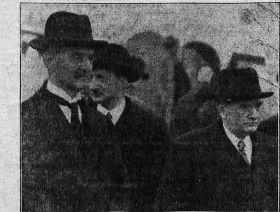
Ti trije so odločali o usodi Češkoslovaške re publike. Z leve na desno angleški ministrski predsednik Neville Chamberlain, francoski zunanji minister Bonnet in francoski ministrski predsednik Daladier. Vsi trije so prepričani, da so rešili evropski mir.