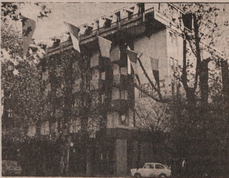
PH-PALACE HOTEL, Corso Italia 63 34 170 Gorizia-Gorica, Italy; Tel.: 0481-82166; Telex 461154 PAL GO 1