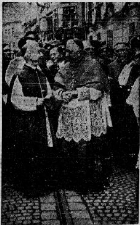
Kardinal-legat Hlond in papeški nuncij nadškof Pellegrinetti