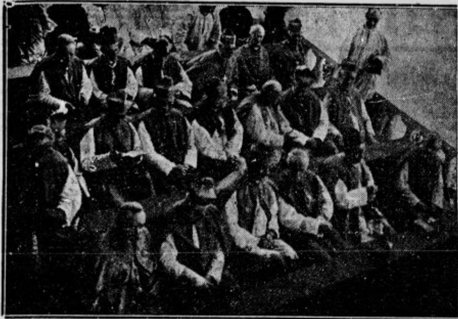
Evharištični kongres: Skupina jugoslovanskih škofov na tribuni