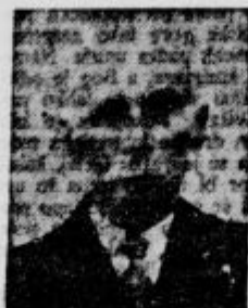
Stoletnica rojstva pesnika Simona Jenka