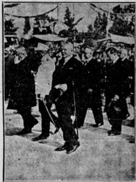
Dr. Korošec, divizionar Nedeljčević in ban dr. Pac pri evharištični procesiji