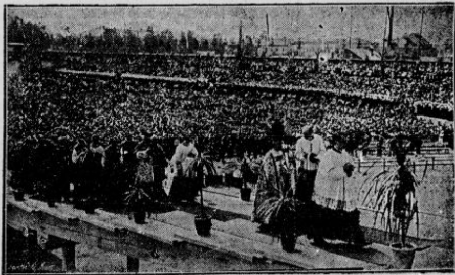
Prihod papeževga legata na Stadion

Drugi dan je obiskal kardinal Verdier predsednika republike Masaryka, ki je papeževga odposlanca pristrčno sprejel prosoš ga, naj zahvali sv. očeta za veliko pazljivost napram Češkoslovaški. Tri dni je bila Praga pozorišče velikih katoliških manifestacij. Vsa prestolica in vse prireditve so bile v znaku manifestacij za katoliško misel. Kdo bi mogel pričakovati pred 15 leti toliki napredek katolištva v Češkoslovaški! Vae časopisje, ne samo v republiki, temveč v vsej Evropi, poroča o zadnjem velikem katoliškem kongresu v Pragi.