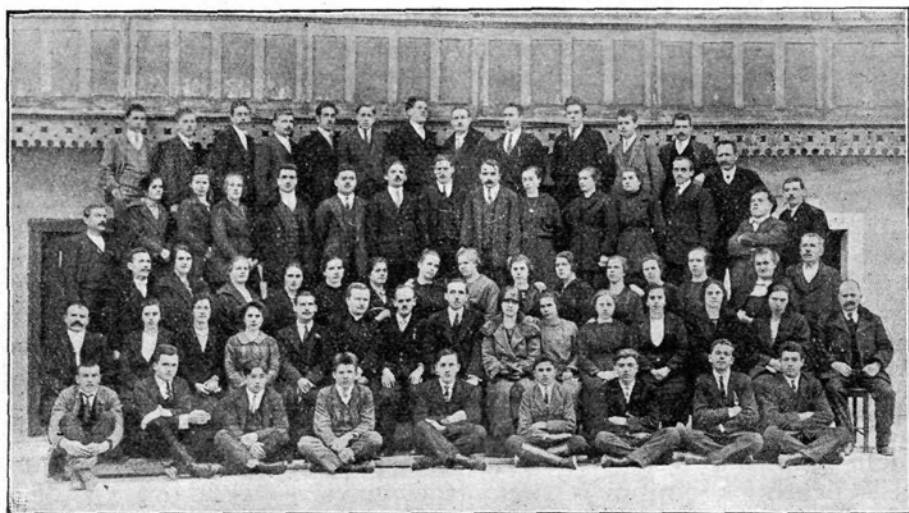
Prosvetno društvo v Črnem vrhu.

nisem mogel tajiti, bal sem se. In tako sem korakal najprvo čisto tiho in oprezno in ko sem prišel v bližino krčmarja Winterja, sem puhnil v diru mimo njega. Pri tem mi je zopet prišla na misel moja stara mati, ki je tudi ležala ob robu poti in ki je v svojih živih dneh tisočkrat rekla: »Fant, ne stopaj tako, saj vendar veš, da me glava boli!« V cerkvi mi je odleglo. Kot ministrant sem imel skoraj vsak dan cerkveno službo in v cerkvi sem se počutil popolnoma doma. Tu ni bilo