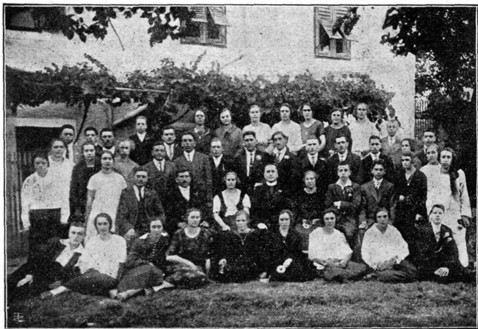
Prosvetno društvo na Planini pri Vipavi.

Župnik je odprl vrata — spoved je bila končana. Vsi smo šli v bolniško sobo. Bil sem tako zmešan, da me je moral duhovnik še le tiho opomniti, naj govorim splošno izpoved grehov. Tako sem začel: »Izpovem se Bogu vsemogočnemu ... ker sem grešil ... moj greh, moj