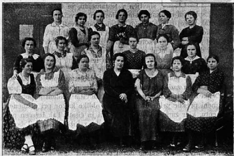
Gospodinjski tečaj „Zveze društev kmetijskih fantov in deklet“ na Brezovici.

Naši kmetijski mladini, mesto da bi doma postavala ali celo posurovela, kar se žal često dogaja, se nudi toraj najboljša prilika, da se brez stroškov dobro pripravi za svoj bodoči poklic samostojnih kmetijskih gospodarjev. Noben pameten gospodar naj toraj te prilike ne zamudi. Naj izbere svojega najboljšega sina za svojega naslednika, naj mu da potrebno strokovno izobrazbo in z mirno dušo in lahko vestjo mu bo v starosti izročil rodno grudo svojo.