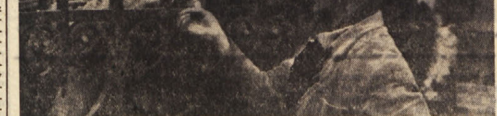
Delavci pogosto zasedajo tovarne, ker se boje, da bi morali povečati že tako preveliko število brezposelnih. (Slika iz zadnjih dogodkov v Florenci)

Te številke nam pojasnjujejo med drugim tudi beg z dežele v mesto. Kmečke proletarske množice, ki so povečini brez strokovne kvalifikacije, pritiskajo na ves industrijski ustroj države in zamažujejo dela v tovarnah v severni Italiji. Bežijo pred bego na podeželju ter se ustavljajo v okolici mest, kjer živijo v pravih broljih, razpadajočih barakah in podobnih zaslužnih hišicah. Tem naselijem pravijo v Italiji ebidonvilles in dobesedno obkrožajo Rim, Milan in Turin ter druga industrijska središča. Možnost za zaposlitev teh revežev, ki zapuščajo južno Italijo, pasivne predele Apeninov in Veneta, je zelo majhna, ker potrebuje industrija kvalificirano delovno silo in ne domaća že zaposlene delavce s stroji. Ker jih industrija odklanja, opravljajo ji reveži različna težka dela ali pa se ukvarjajo s krošnjarstvom. To nam potrjujejo tudi statistike o brezposelnosti, saj znaša v gradbeništvu, kjer je največ delavcev brez kvalifikacije, okrog četrtno.