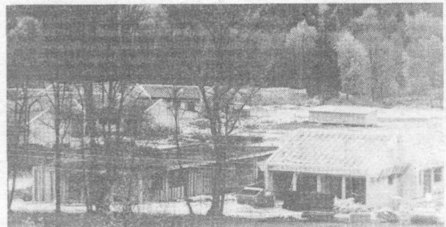
Pred nekaj tedni je gradbišče Zavoda za varstvo in delovno usposabljanje otrok in mladostnikov v Dragi pri Igu nudilo tako podobo. Sedaj delavci SGP Grosuplje in njihovi kooperanti zaključujejo I. fazo gradnje objektov zavoda in se pripravljajo na pričetek druge faze. Zavod gradijo po projekti Olge Kusanove.