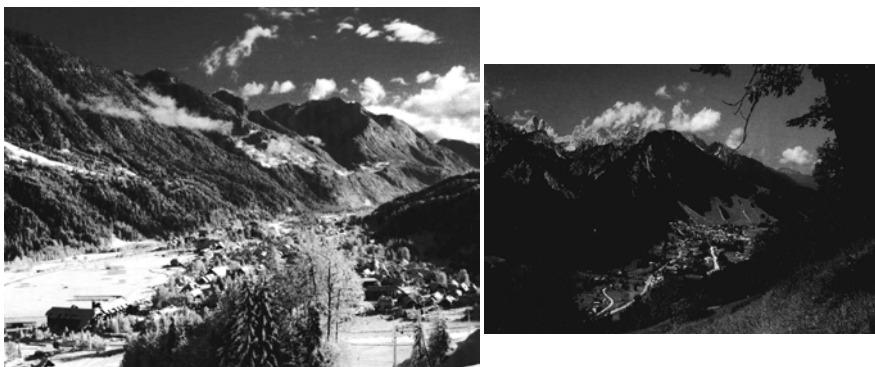
vir: Turistična brošura Kranjska Gora, TD Kranjska Gora, 1998.

Kljub turističnemu razvoju se je ohranil stari razpored vaškega naselja. Okrog starega vaškega jedra je zrasel nov, turistični del naselja - hoteli, penzioni in počitniška stanovanja, rekreacijski objekti in trgovsko središče. S sosednjimi naselji (Gozd-Martuljk, Podkoren, Rateče) ter dolinama Planico in Veliko Pišnico predstavlja enotno turistično območje s skupnimi pešpotmi, žičnicami, smučišči ter progami za hojo in tek na smučeh. Pozimi povezuje kraje smučarski avtobus. Prirajamo tudi mednarodna tekmovanja v alpskem smučanju na Vitrancu ter v smučarskih skokih in poletih v Planici. Seveda pa Kranjska Gora ni zanimiva le v zimskem času, ampak s svojo pestro ponudbo in različnimi možnostmi za rekreacijo privlači turiste vse leto."(Slovenija, 1995, 109 - 114)