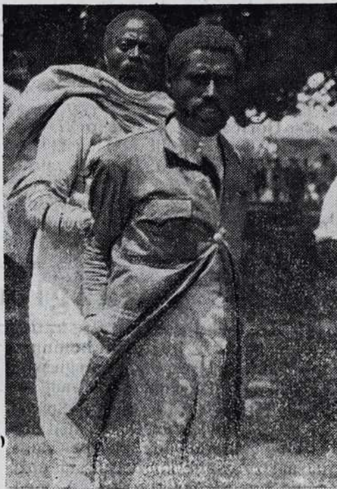
Abesinski ropar. Po abesinskom boji jih je vse puno takših. Siromaški abesinski narod so prle skoro vsi gülliti. Zato ne čüdo, če se je siromak vrgeo na roparjio, da se tak preživé.