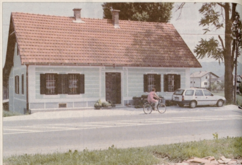
Ena lepših, okusno urejenih starejših stavb v Staršah

V neposredni bližini cerkve, samo čez cesto je tudi šola (zadaj še vrtec), ki kar sije v svoji čisto novi rumeni preobleki in tudi za njeno okolico je lepo poskrbljeno. Ko pa se po glavni cesti odpravite nekaj metrov naprej, srečate še eno obnovljeno zgradbo starejšega letnika. Skrita je med drevesi, na njej pa piše, da je tam sedež občine. Če bi si Starše hoteli zapomniti po čem posebnem, potem bi bilo najboljše po rumeni barvi, kajti v naselju je rumeno pobarvanih kar nekaj zgradb. V oči pa nam je padla tudi obnovljena hišica v zeleni barvi. V tem primeru se vidi skrbna roka njenih lastnikov in po njih bi si lahko vzgljed še marsikdo drugi v Staršah. Na primer manjše blokovsko naselje, ki bi ob obnovi zgradb vsekakor nujno potrebovalo, starejšega letnika je tudi gasilski dom, domačini pa so že lepo obnovili številne kapelice. Imajo tudi svojo bencinsko črpalko, posebnost Starš in okoliških naselij pa so okrogli stolpiči, namenjeni plakatanju - na vrhu so zelene barve in z napisom vsakega