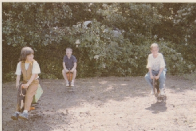
Otroci so najbolj veseli tobogana in gugalnic

Pravzaprav teče že 51. leto, odkar so v zgradbo sredi Grajene, v osnovi namenjeno za nemško bolnišnico, naselili osnovnošolce. Takrat je bila to samostojna osnovna šola za 128 otrok, do danes pa je status zaradi spreminjanja števila otrok nekajkrat spremenila. Iz samostojne je postala podružnična šola šole v Ljudskem vrtu na Ptuj, iz sedemletke se je preko šest- in štiriletke oblikovala v današnjo osemletko. Obiskuje jo 160 učencev.