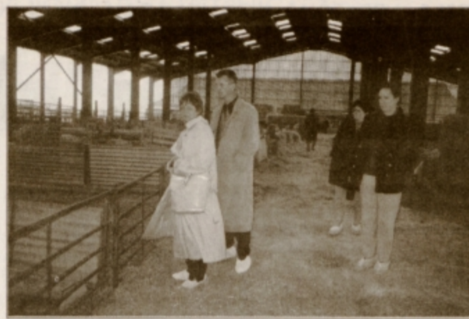
Šolska farma je stičišče teorije in prakse

Ob zbiranju vtisov smo nenehno vrednotili tamkajšnje razmere in jih primerjali z našim šolskim vsakdanom. Če odmislimo materialne in splošne delovne pogoje, ki so v tujini nadvse zaviljivi, je zagotovo pri nas potrebno čimprej uveljaviti sistem permanentnega izobraževanja, v katerem bo šola stalna sooblikovalka človekovega osebnega in poklicnega razvoja. Kljub temu da nas zahtevna evropska konkurenca usmerja k temu, se zavedanje o pomembnosti in potrebnosti znanja prepočasi uveljavlja. Tudi strokovna in svetovalna dejavnost ter neposredni prenos znanja v prakso so svojevrstni izживi, ki jim bodo morale naše kmetijske šole slediti bolj kot doslej. Tako vsaj ne bomo odvis-