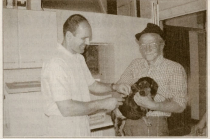
Nekaj minut po tem, ko so prisotni nazdravili odprtju, je bil v ordinaciji tudi že prvi pacient

Veterina obstaja v ormoškem prostoru že okrog 50 let. Na začetku je bila organizacijsko pod okriljem kmetijske zadruge, potem pa se je leta 1956 preoblikovala v samostojno veterinarsko organizacijo, ki je delovala pri znamenitem Biku na Ptujski ulici. Leta 1973 so se pričele aktivnosti za postavitev nove veterinarske ambulante, saj stari prostori niso več ustrezali predpisom. Odprli so jo 17. junija 1977 kot veterinarsko postajo Ormož, ki se je čez tri leta formalno združila s ptujsko in slovenjebistriško veterino v Obdravski zavod za veterinarstvo živinorejo. Od 1. junija letos pa je vse drugače.