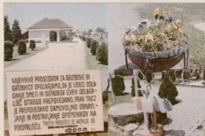
Urejeno pokopališče v štirih detajlih