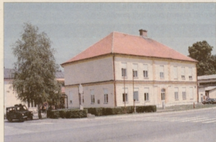
Z novo, rumeno barvo se ponša tudi osnovna šola