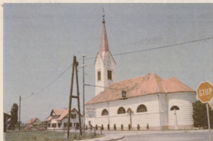
Obnovljena cerkev Sv. Janeza

SALON POHIŠTVA INTERDOM Ob Dravi 3/a, PTUJ Tel: 783 816 TEDEN PISARNIŠKEGA POHIŠTVA PISARNIŠKI STOLI (vrteči) ZE OD 12.100 SIT