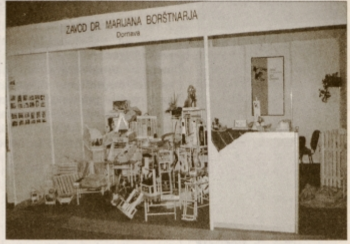
Razstavni prostor VDC Zavoda dr. Marijana Borštnarja Dornava je bil zelo obiskan. V prihodnje bodo imeli še več poslovnih partnerjev - teh je bilo doslej okrog 100.

tistih, ki stanujejo doma in prihajajo dnevno samo delat. Varovanci z velikim veseljem in tudi znanjem ustvarjajo izdelke in to se pozna tudi na njihovi kvaliteti, saj se lahko primerjajo z drugimi proizvajalci.