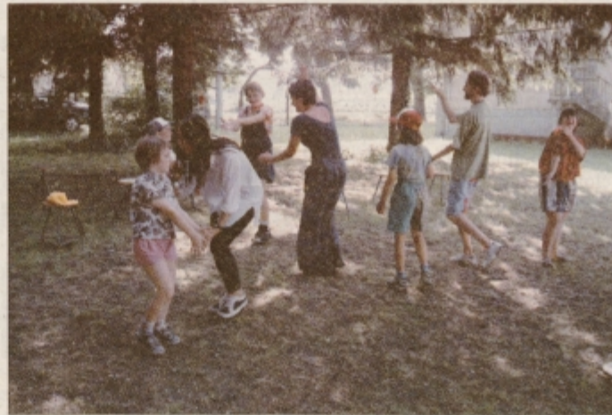
Kako prijetno je plesati po travi!