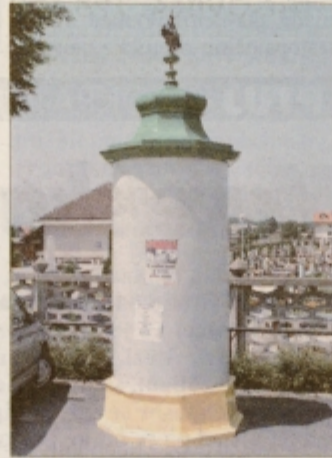
Zanimivi plakatni objekti