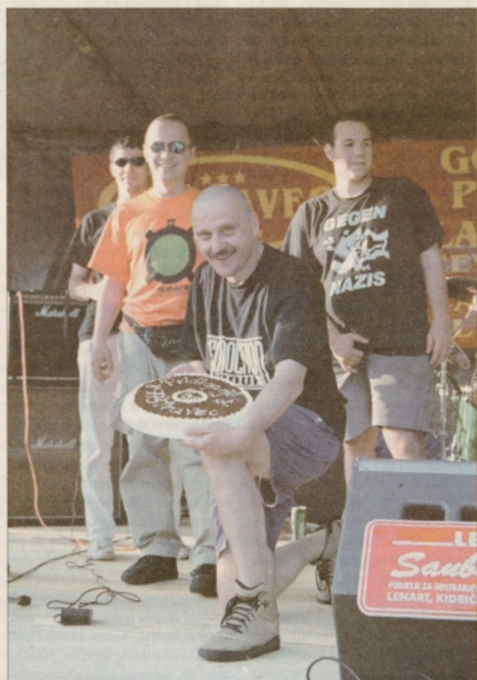
Najbolje so igrali košarko in si prislužili super torto skupina Demolition Group