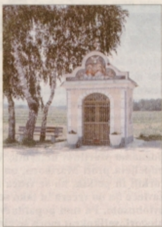
Popotnik, postoj in si odpočij

Nekoč so Starše že bile samostojna občina, z novo lokalno samoupravo pa jim je to bilo vrnjeno: občina in župnija se znova ujema. Samo v Staršah živi blizu 760 prebivalcev, mnogo v kmečkih gospodinjstvih, kar je tudi tipično za obrobni predel Dravskega polja. Župnijska cerkev je srce župnije,