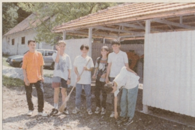
Poučen in koristen za vse krajanje je ekološki otok, kamor bodo ločeno odlagali steklenice, papir, ostale odpadke ...

Otroci, učitelji in krajanje bi bili najsrečnejši, če bi se lahko ob prazniku šole pohvalili z prenovljeno in razširjeno šolsko zgradbo ali vsaj telovadnico. Šola namreč že nekaj let opozarja na nevezdržne razmere. Resda imajo enozimski pouk, vendar tudi v kletnih, vlažnih in temnih učilnicah. Telovadnice šola nima. Načrte za adaptacijo in razširitev imajo pripravljene že nekaj let, ob občinskega vrstnega reda dogradnje šol pa je odvisno, kdaj bodo na vrsti.