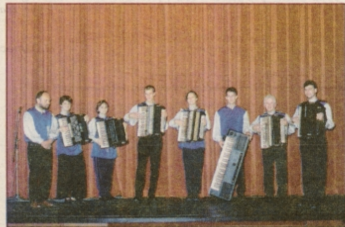
Harmonikarska skupina Holermus.