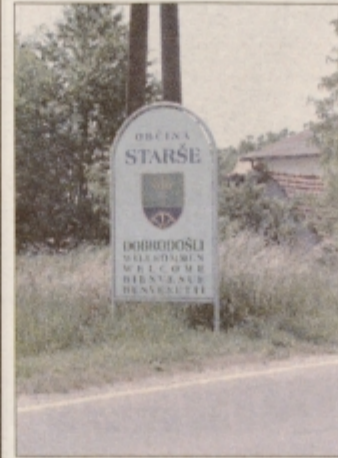
Dobrodošli v Staršah