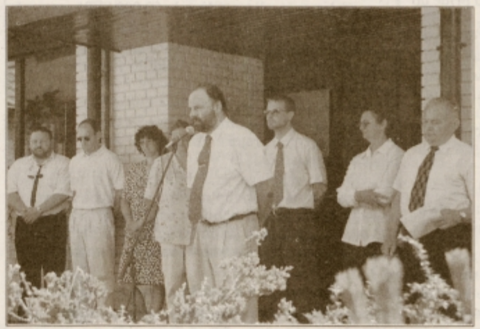
Slavnostno odprtje stare - nove veterine