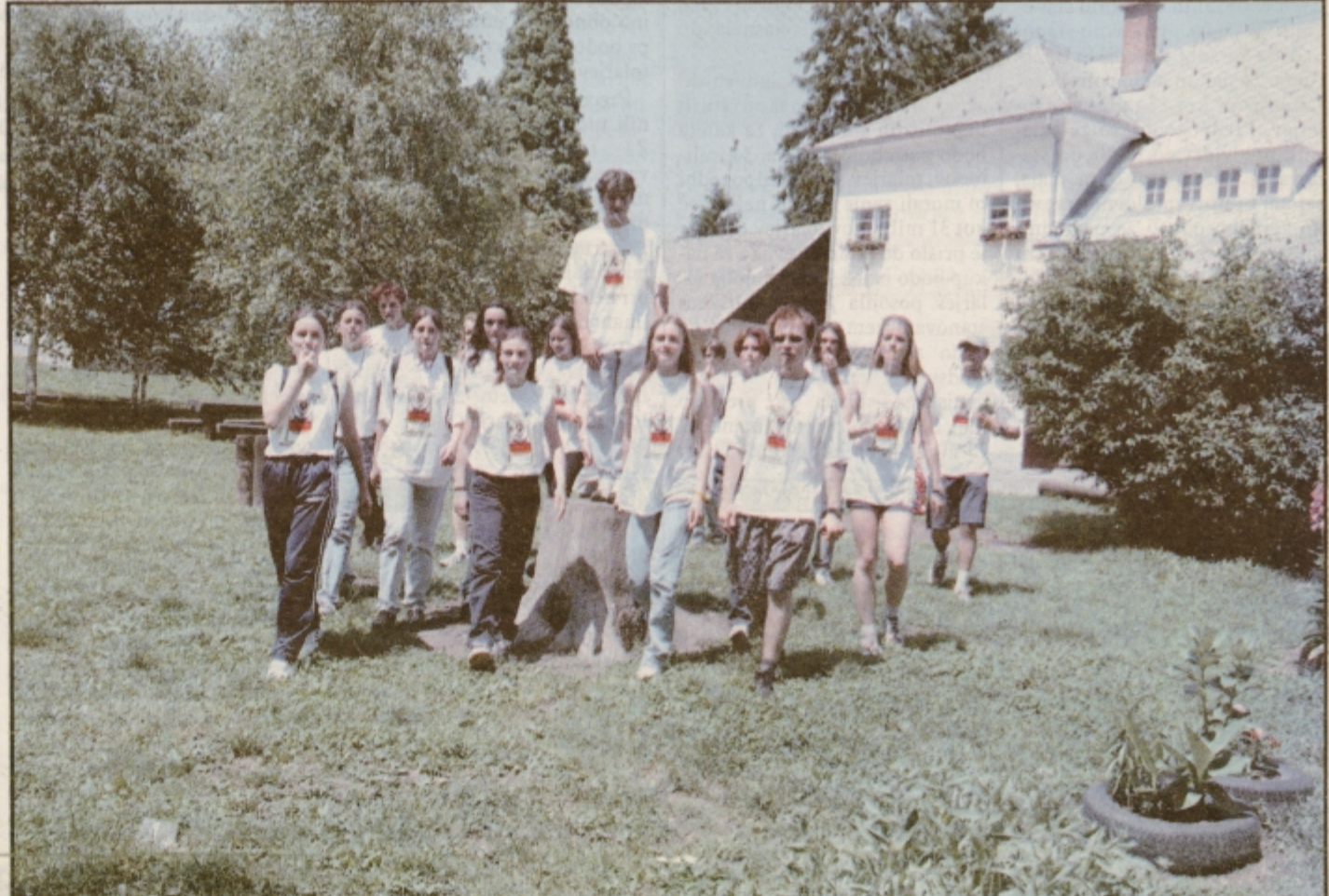
Približno 800 dijakov petih šol ptujskega šolskega centra se je prejšnji petek poslovilo od svojih klopi, profesorjev in knjig. Svoj vstop v svet odraslih so tudi tokrat glasno oznanjali po vsem mestu. Srečno pot!