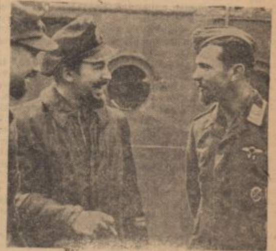
Flieger mit U-Boot-Bart.

Tako sem končno vendarle dosegel tolikanj zaželjeno pohvalo in priznanje, a moje predavanje s strani poslušalcev ne manj zaželeni — konec.