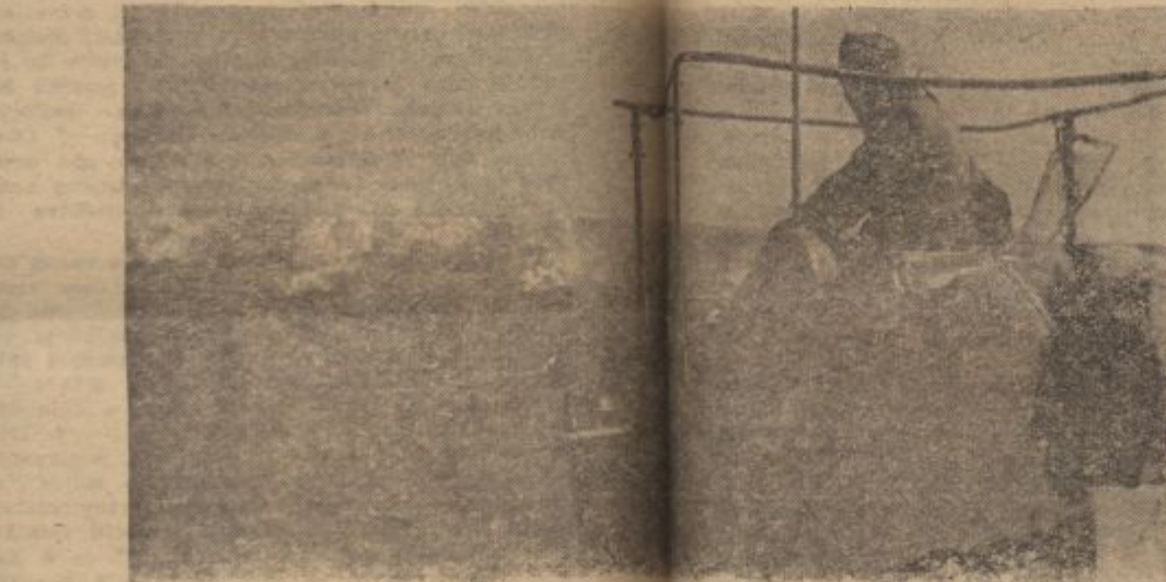
Beim Sicherungsflug an der Mittelmeerküste.

Der schnelle deutsche Jäger vom Typ „FW 190“ beim Sicherungsflug an der Mittelmeerküste von Marseille.