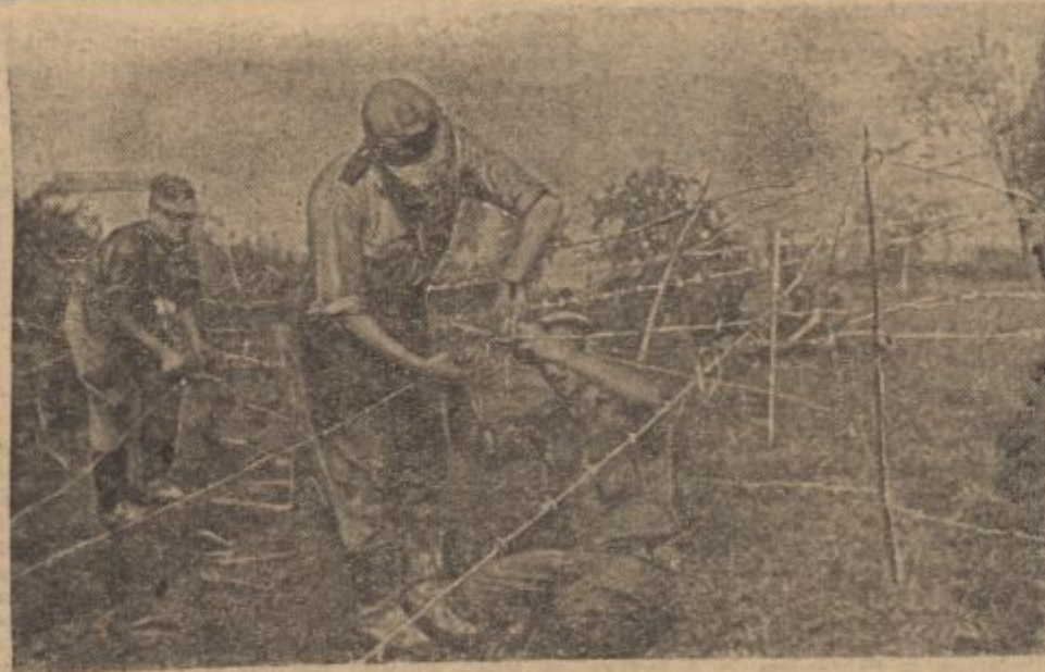
An der südlichen Front.

Das Vorfeld des Höhenzuges an der südlichen Front wird gründlich verdrahtet.