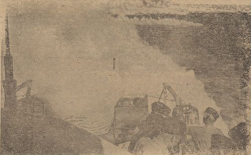
Ein Hafen wird eingeebelt. In einem ägäischen Hafen ertönt die Allarmsirene. Die Sicherungsboote legen ab. Sie nebeln das Hafengebiet ein, um es der Sicht feindlicher Flugzeuge zu entziehen.

eigenen Schlauchboote mit Notinstrumenten und Proviant die „Geretteten“ und die Besatzung aufnehmen. Ein Bordschütze erlebte das bereits zum siebenten Male. So endete eine dieser abenteuerlichen Luft- und Seereisen sogar, hier Jules Verne übertrumpft, mit einer Unterwasserfahrt, denn ein deutsches U-Boot nahm den Schlauchboot-Schleppzug an Bord und setzte wegen Luftgefahr seine Heimreise getaucht fort.