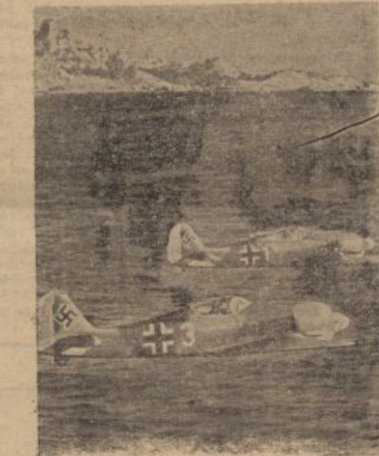
PK.-Kriegsb. Bankhardt — PBZ (GD)