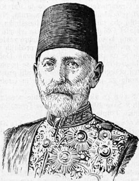
Turkhan-paša, novi albanski ministrski predsednik.

ima knez Viljem trdo voljo, v albanski deželi ustvariti mir in red in prebivalstvu dati boljšo bodočnost in blagostanje.