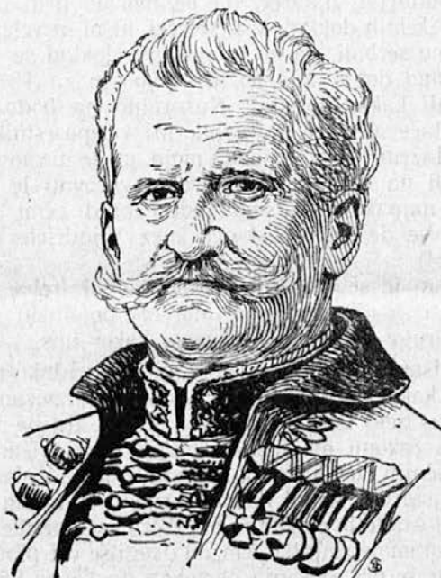
Feldcajgomjster baron Geza Fejervary, ki je nevarno obolel.

Zadnji vitez reda Marije Terezije, feldcajgomjster Fejervary, je v starosti 81 let neozdravljivo zbolel za rakom. Fejervary, ena najmarkantnejših osebnosti na Ogrskem, je nekaj časa kot ogrski ministrski pred-