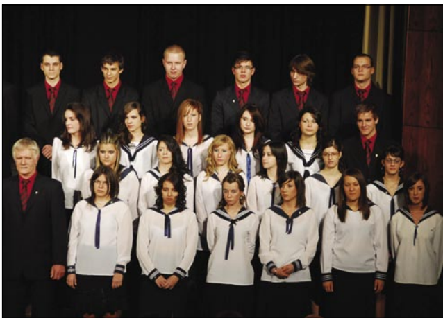
Na proslavi v uniformi gimnazije

Na koncu pa bi vsem maturantom zaželela veliko sreče