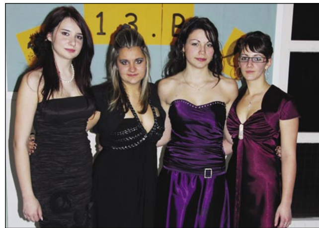
Slovenske dijakinje 13. B razreda

mestnim gledališčem, kjer se je odvijal prvi del vate. Program se je začel ob petih. Najprej s o